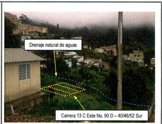
Fotografía 2. Zona donde se ubican los predios de la Carrera 13 C Este No. 90 D – 40 Sur, la Carrera 13 C Este No. 90 D – 46 Sur y la Carrera 13 C Este No. 90 D – 52 Sur.