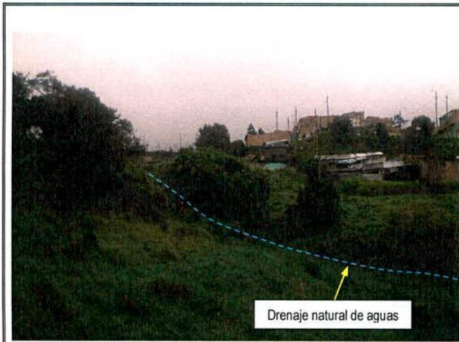
Fotografía 1. Ladera donde se localizan los predios de la Carrera 13 C Este No. 90 D – 40 Sur, la Carrera 13 C Este No. 90 D – 46 Sur y la Carrera 13 C Este No. 90 D – 52 Sur.