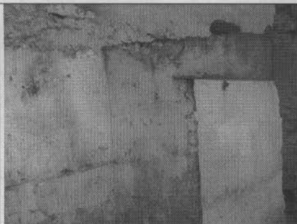
Foto 3. Muros deteriorados.