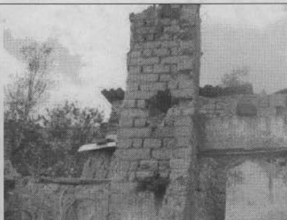
Foto 2. Desprendimiento de tramos de muros, existe riesgo de afectación a transeúntes.