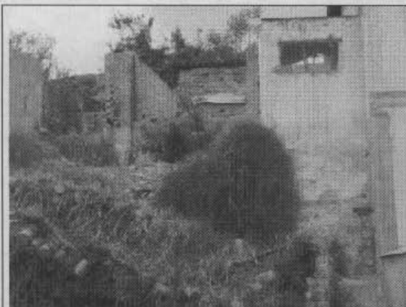
Foto 1. Condiciones de la construcción al momento de la visita.