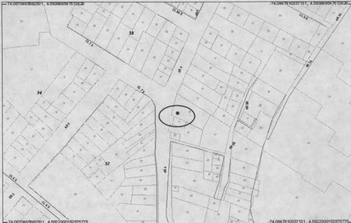
Localización del Inmueble Objeto del Concepto

Este concepto corresponde a la visita de inspección para verificar el estado y condiciones del inmueble ubicado en la Carrera 4 N° 7 - 12 sur, con el fin de establecer si amenaza ruina o no.