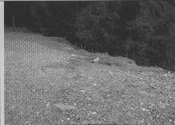
Foto 6. Escombros cercanos a parque infantil.