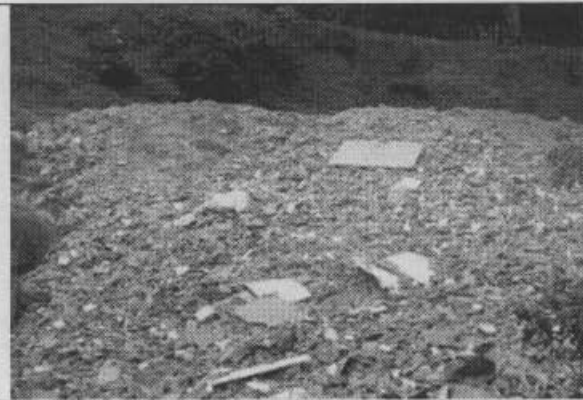
Foto 5. Colocación de escombros en talud aledaño