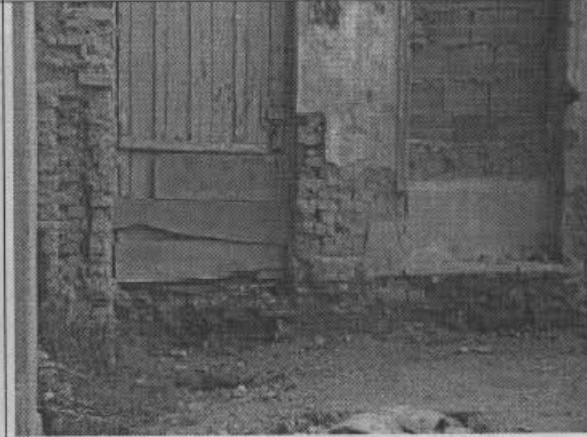
Foto 4. Pérdida de apoyo parte inferior.