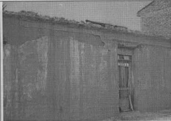
Foto 1. Fachada en el momento de la visita.