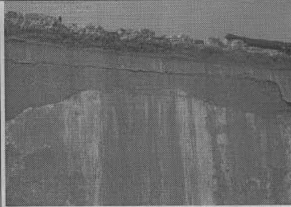
Foto 2. Desprendimiento de zonas del muro de cerramiento.