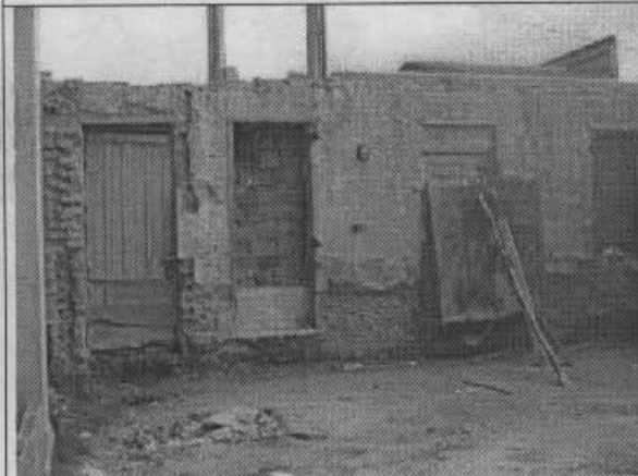
Foto 3. Cara interior del muro.