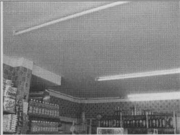
Foto 2. Aspecto interno de la edificación en primer piso