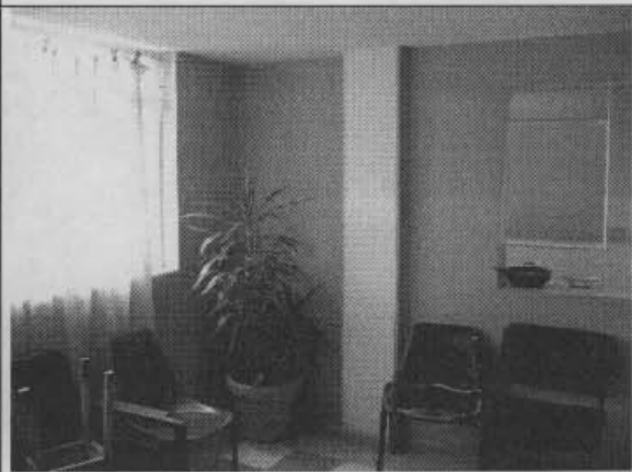
Foto 4. Los elementos estructurales no presentan daños