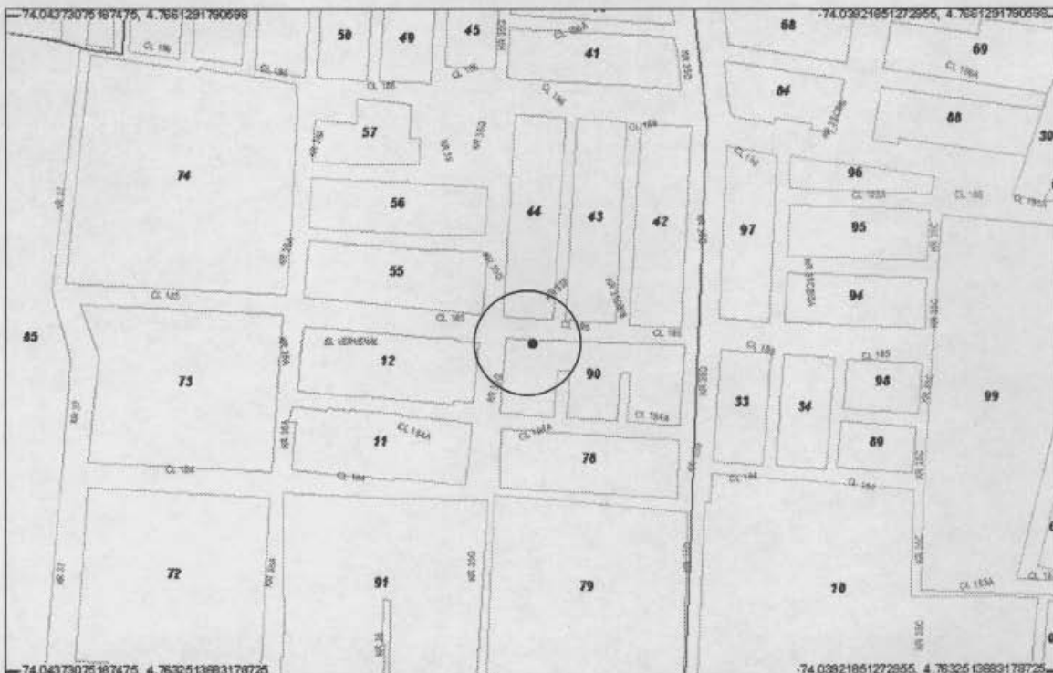
Localización del Inmueble objeto del Concepto

Este concepto corresponde a la visita de inspección para verificar el estado y condiciones del inmueble ubicado en la Calle 185 # 35 F - 25, con el fin de establecer si amenaza ruina o no.