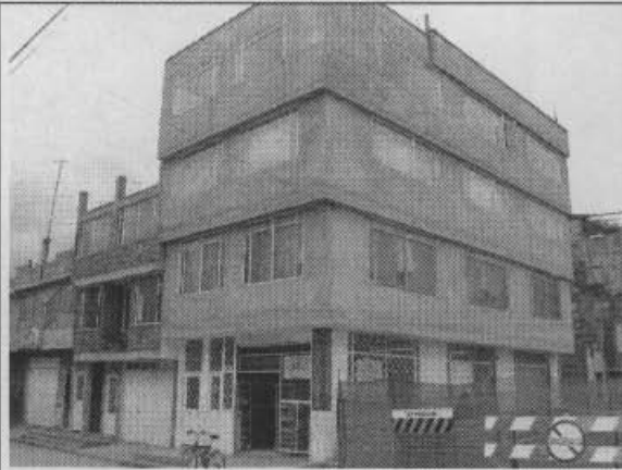
Foto 1. Fachada de la edificación objeto del concepto