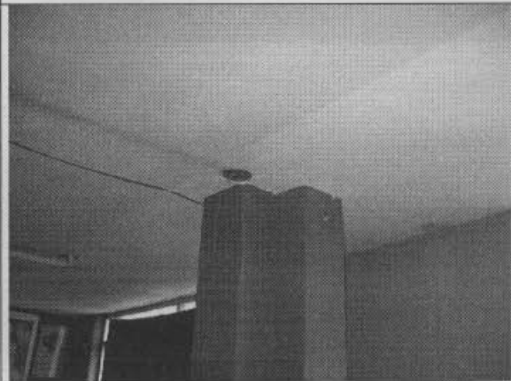
Foto 6. Nudo placa-columna sin afectaciones visibles