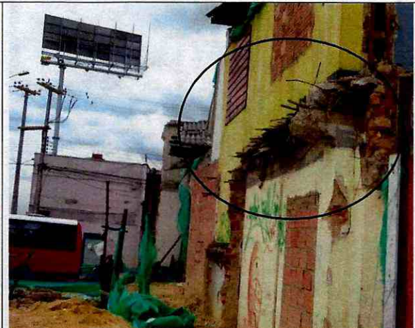
Foto 2. Fachada costado sur, elementos con posibilidad de desprendimientos (agosto 29 de 2011).