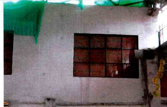
Foto 6. Muros internos del costado norte en buen estado (agosto 29 de 2011).