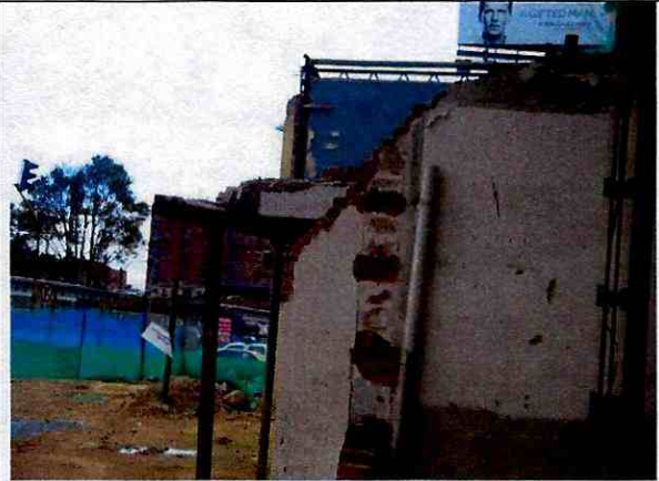
Foto 12. Muros del costado sur fisurados, desprendimientos de elementos en la parte superior. Apuntalamiento provisional del mezanine . (19 de Octubre de 2011)