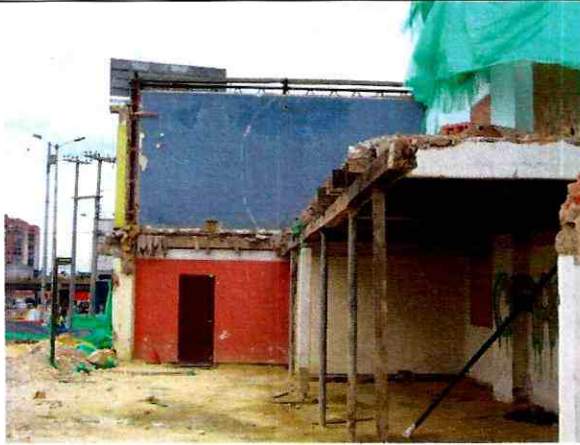
Foto 3. Apuntalamiento provisional de mezanine en el costado sur del predio (agosto 29 de 2011).