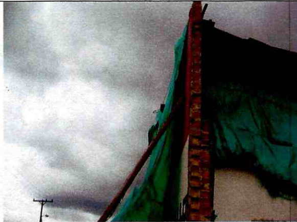
Foto 11. Elementos con posibilidad de desprendimiento en la parte superior del muro del costado occidental. Se evidencian condiciones de inestabilidad en la parte superior del muro (19 de Octubre de 2011)