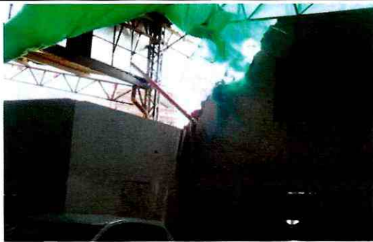
Foto 5. Desprendimientos de unidades de mampostería en muro del costado sur del predio (agosto 29 de 2011).