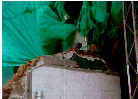
Foto 4. Muro de mampostería con desprendimientos de unidades, costado sur del predio (agosto 29 de 2011).