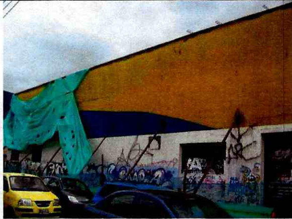
Foto 9. Vista del muro de fachada del costado occidental del inmueble. (19 de Octubre de 2011)