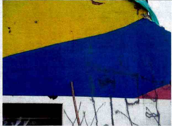
Foto 10. Fisuras horizontales y verticales en la parte superior del muro de fachada. (19 de Octubre de 2011)