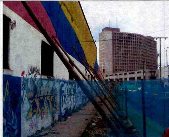
Foto 1. Aspecto general de la fachada del costado occidental, apuntalamiento provisional (agosto 29 de 2011).