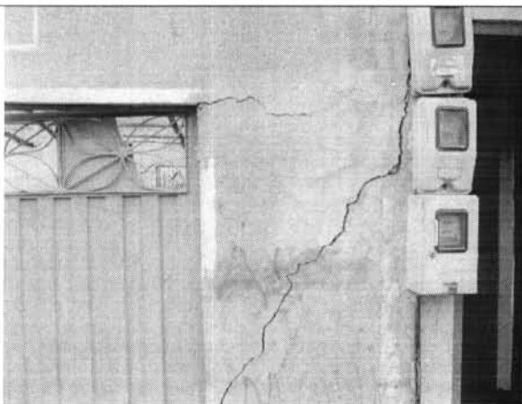
Foto 3. Detalle de las grietas en los muros de la fachada.