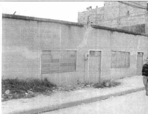
Foto 1. Fachada de la Edificación en las condiciones presentes al momento de la visita.