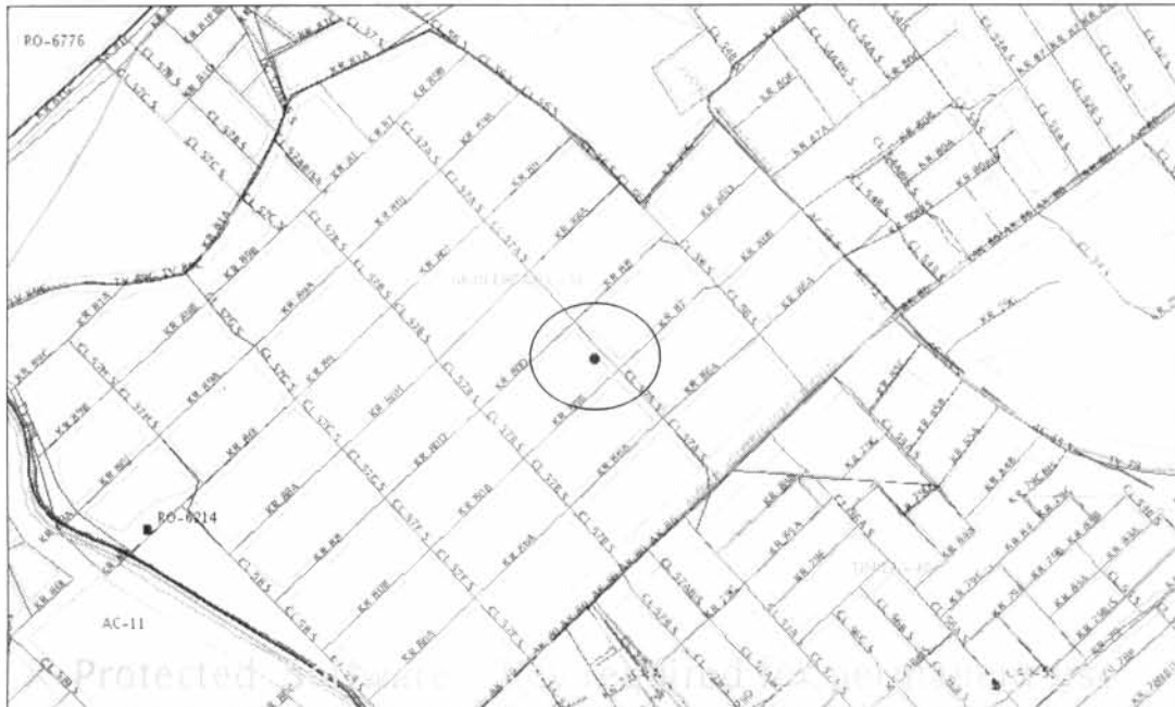
Localización del Inmueble objeto del Concepto

Este concepto corresponde a la visita de inspección para verificar el estado y condiciones del inmueble ubicado en la Calle 57 A Sur No. 80 B - 31, Antigua Dirección Calle 57 A Sur No. 87 - 31, con el fin de establecer si amenaza ruina o no.