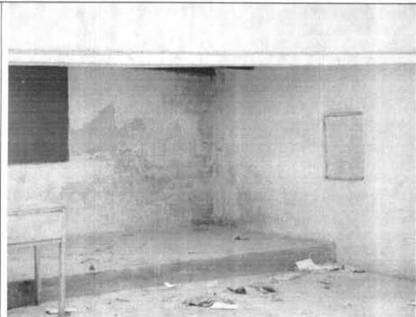
Foto 6. Deterioro de los acabados de los muros por humedad e intemperismo.