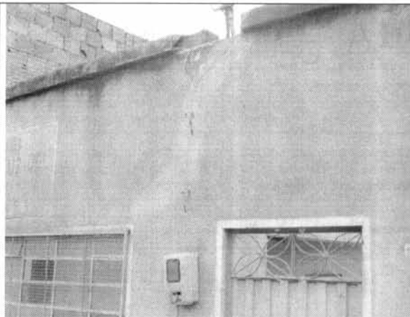
Foto 2. Agrietamiento fuerte en los muros de fachada.