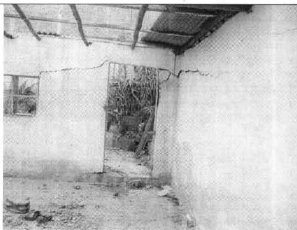
Foto 4. Agrietamiento severo en los muros interiores de la edificación.