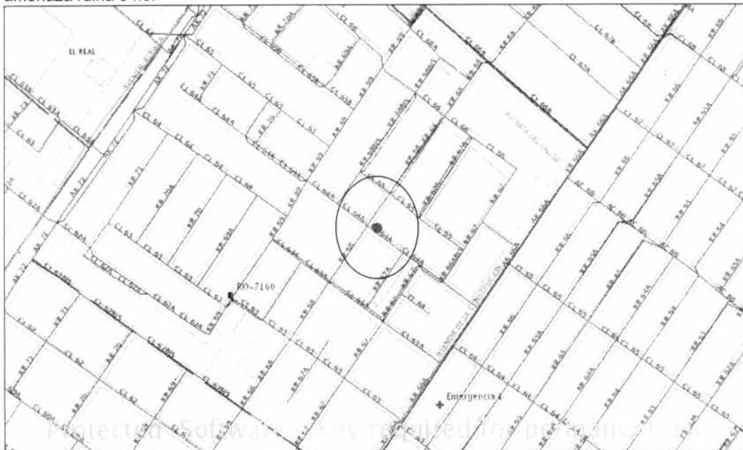
Localización del Inmueble objeto del Concepto

Este concepto corresponde a la visita de inspección para verificar el estado y condiciones del inmueble ubicado en la Calle 64 A No. 67 A - 26, nueva dirección Calle 64 I # 70C - 52 con el fin de establecer si amenaza ruina o no.