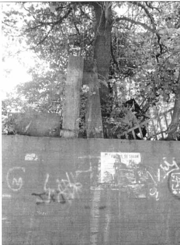
Foto 7. El crecimiento de estos árboles está induciendo cargas horizontales al muro, que no está en capacidad de resistir.