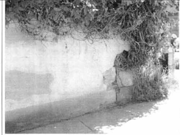
Foto 4. Detalle de la fractura en la base del muro occidental.