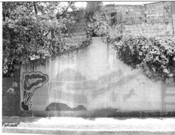
Foto 5. Otra sección del muro occidental del inmueble, presenta menor crecimiento de arbustos.