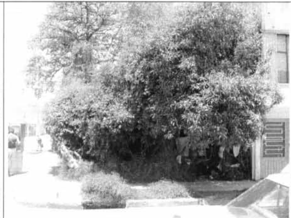
Foto 2. Crecimiento desmedido de vegetación, puede generar problemas estructurales.