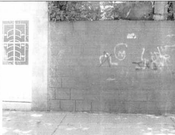
Foto 6. Muro con agrietamientos, el crecimiento de árboles y arbustos generan deterioro.