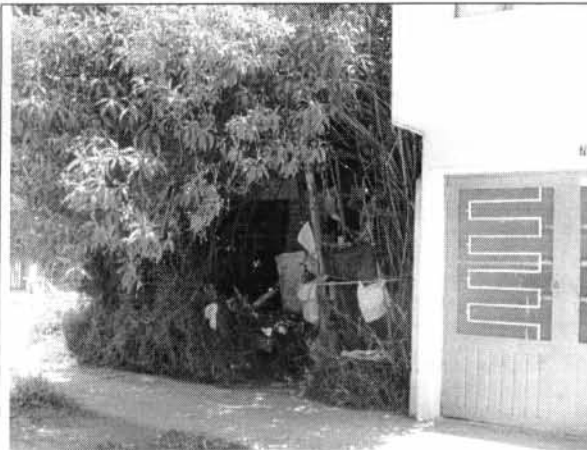
Foto 1. Fachada de la Edificación en las condiciones presentes al momento de la visita.