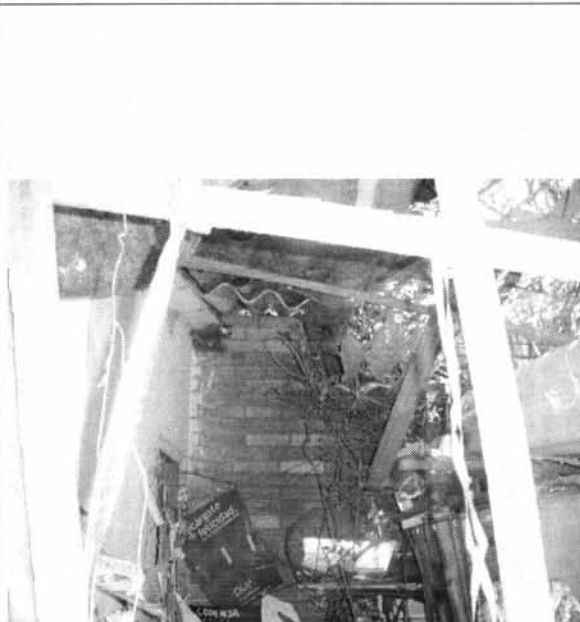
Foto 8. Entrada de la vivienda, existe acumulación de basuras.