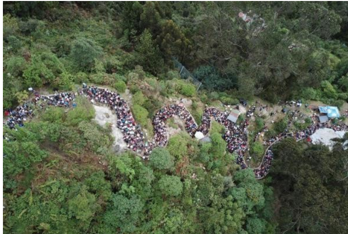
Este era el panorama, desde el aire, del sendero de Monserrate en Viernes Santo.

Por ahora, se sabe que el Domingo de Ramos 22.351 personas usaron el camino de piedra; el Jueves Santo, 35.615 y este Viernes Santo, 78.676. Solo esos tres días ya suman un acumulado de 136.642 visitantes por esa vía.