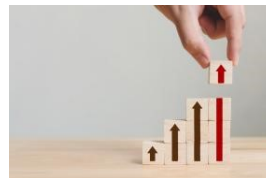
Invierta en un CDAT y haga realidad sus sueños