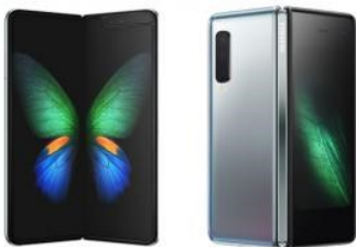
Celular plegable de Samsung saldrá al mercado en septiembre