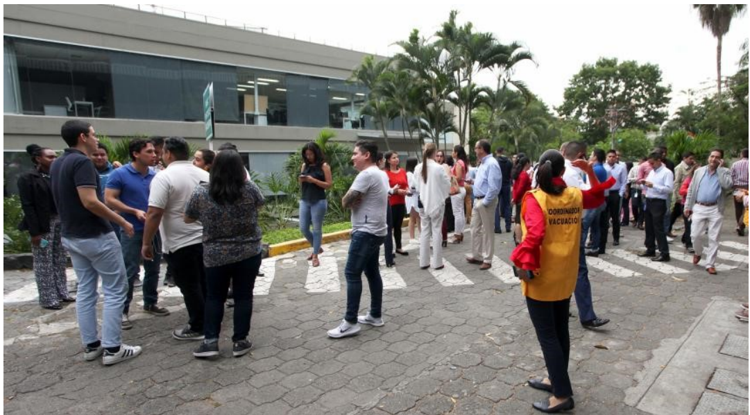
En su preparación, ubique lugares seguros a los que pueda evacuar.