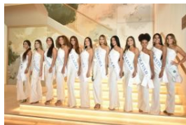
Santa Marta metida en las Fiestas del Mar