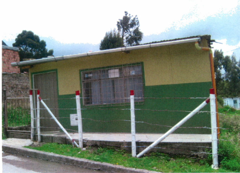
Foto 1. Aspecto general de la vivienda construida en el predio de la CALLE 46 H SUR # 17 – 67 ESTE en la localidad de San Cristóbal.

Según el “Estudio de Zonificación por Inestabilidad del Terreno para Diferentes Localidades en la Ciudad de Santafé de Bogotá D.C.”, Estudio Geológico (INGEOCIM, FOPAE, 1998), la zona donde se encuentra el predio objeto de este concepto, está cubierta por depósitos fluvioglaciares; conforme con el mencionado estudio, los depósitos fluvioglaciares constan de bloques y cantos de arenisca de formas subredondeadas a subangulares algo planares provenientes de las rocas del Grupo Guadalupe, los cuales se encuentran embebidos en una matriz limoarcillosa; el tamaño de los bloques es muy variado, alcanzando tamaños relativos hasta de 5 metros y su proporción con respecto a la matriz es de un 40 a 60%; como característica especial de los citados depósitos, se tiene que presentan un espesor uniforme cuando cubren zonas relativamente pequeñas; por otra parte, dadas las características físicas y mecánicas de los depósitos fluvioglaciares, estos permiten el almacenamiento y flujo de agua subsuperficial de acuerdo con su posición respecto a la topografía. Cuando estos depósitos se encuentran saturados y en laderas de pendiente alta, son susceptibles a inestabilizarse.