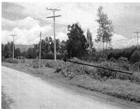
Foto2. El sector no cuenta con alcantarillado, por lo tanto existe a ambos lados de la Avenida Guaymaral un canal de manejo de aguas lluvias y negras del sector.