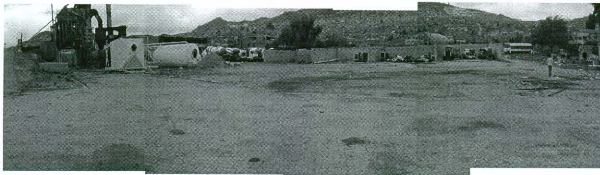
Foto 1. Panorámica del Predio CEMEX. La mayor parte del predio presenta topografía plana. La pared que se observa al fondo corresponde al lindero occidental del predio, al lado derecho (norte) el predio limita con una quebrada que transporta aguas lluvias y negras del sector.