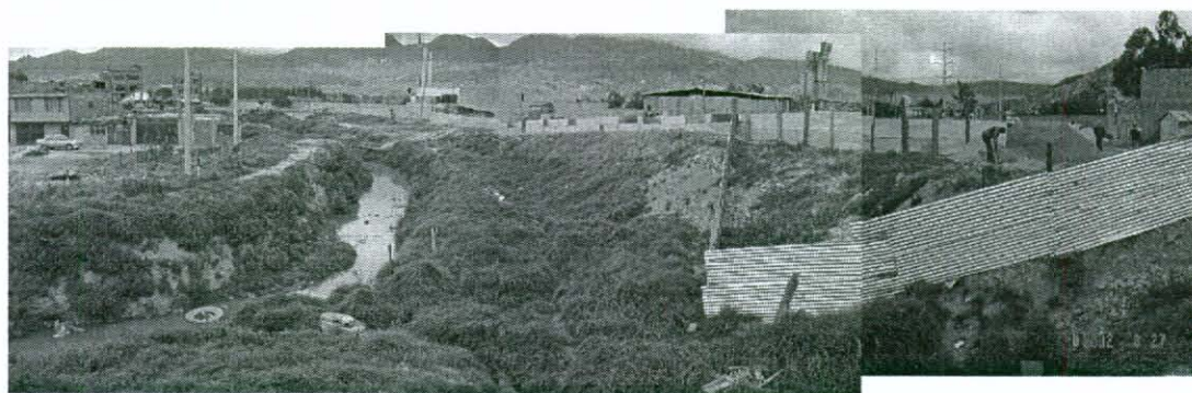
Foto 2. Panorámica del Predio CEMEX. Se observa el lindero norte del predio, este sitio presenta rellenos constituidos de materiales de construcción, al lado izquierdo se observa la quebrada Zanjón de la Estrella que transporta aguas lluvias y negras del sector.

Foto 1. Panorámica del Predio CEMEX. La mayor parte del predio presenta topografía plana. La pared que se observa al fondo corresponde al lindero occidental del predio, al lado derecho (norte) el predio limita con una quebrada que transporta aguas lluvias y negras del sector.