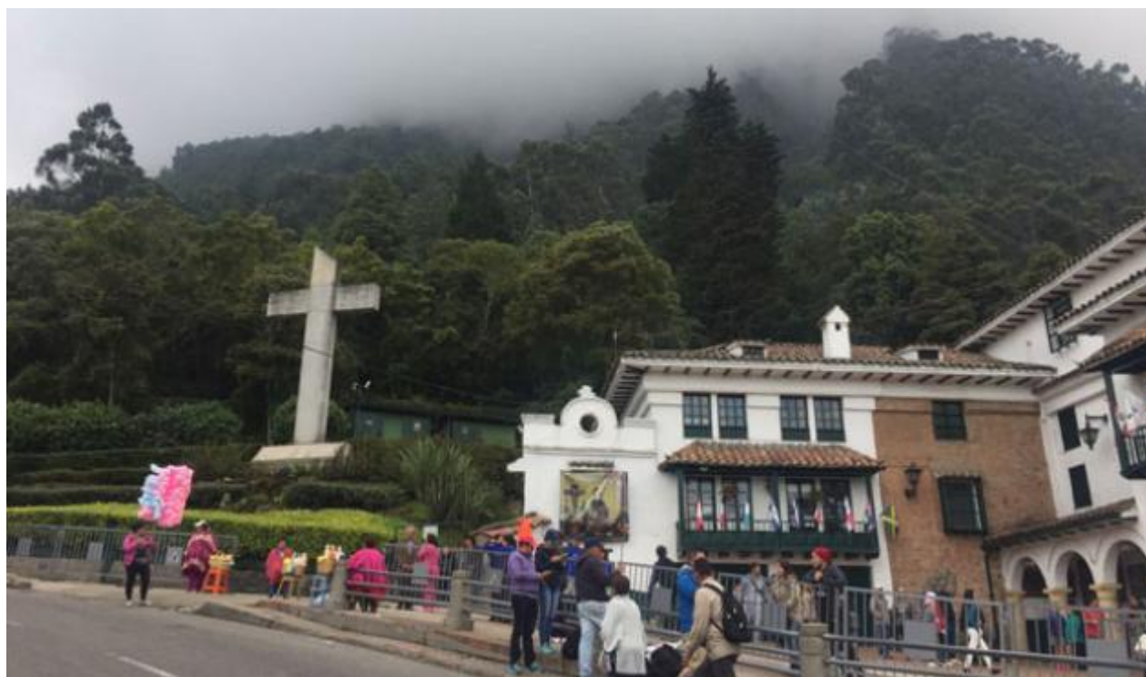
BOGOTÁ (/BOGOTA) 10 Abr 2017 03:28 AM