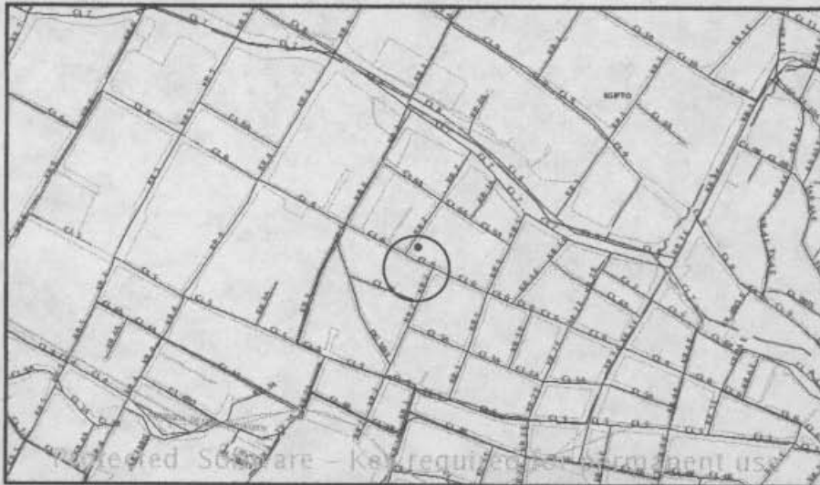
LOCALIZACION DEL PREDIO DEL CONCEPTO

Este concepto corresponde a la visita de inspección para verificar el estado y condiciones del ubicado en la Carrera 2 # 6-14, con el fin de establecer si amenaza ruina o no.