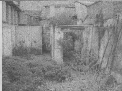
Foto 2. Estructura parcialmente demolida.