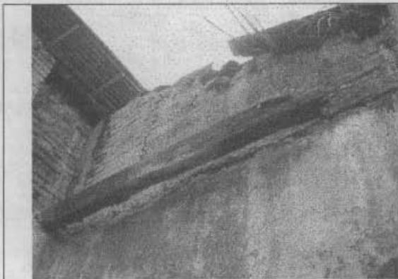
Foto 3. Elementos estructurales sueltos.