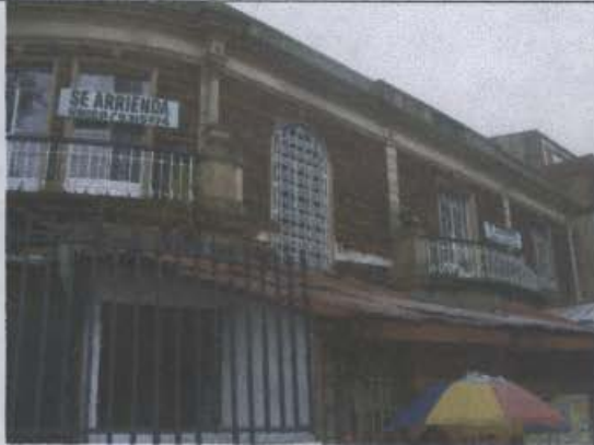
Foto 1. Fachada sobre la Calle 67