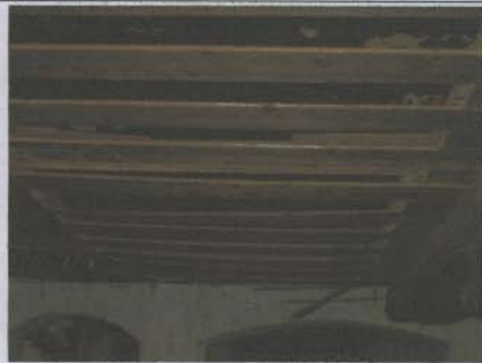
Foto 3. Cielos Rasos en mal estado