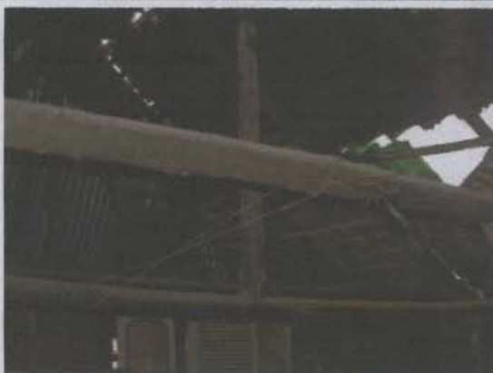
Foto 5. Construcción en madera en el antejardín en mal estado.