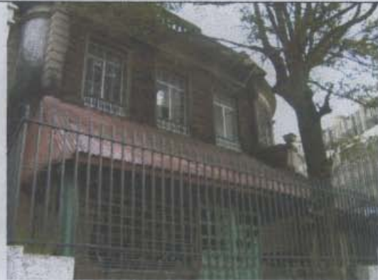
Foto 2. Fachada sobre la carrera 13