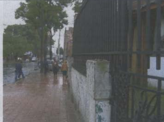
Foto 6. Muro de cerramiento.