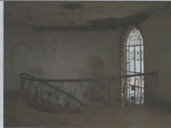
Foto 4. Interior del inmueble.