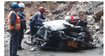
Serían 5 las víctimas del derrumbe en la vía Bogotá-Villavicencio