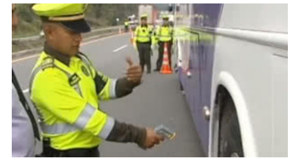
Habría déficit de policías y guardas de tránsito en el país