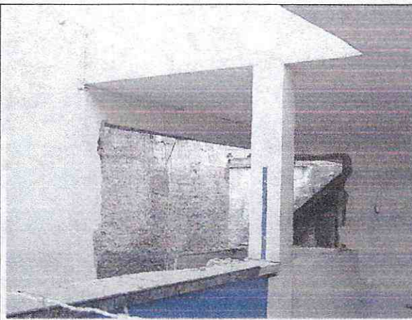
Foto 6. Inmueble abandonado y en deterioro.