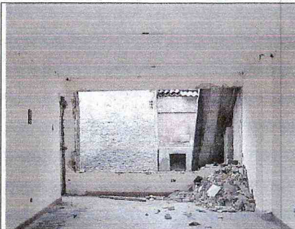
Foto 5. Deterioro progresivo de la edificación. La cubierta presenta un 30 % de daño total.