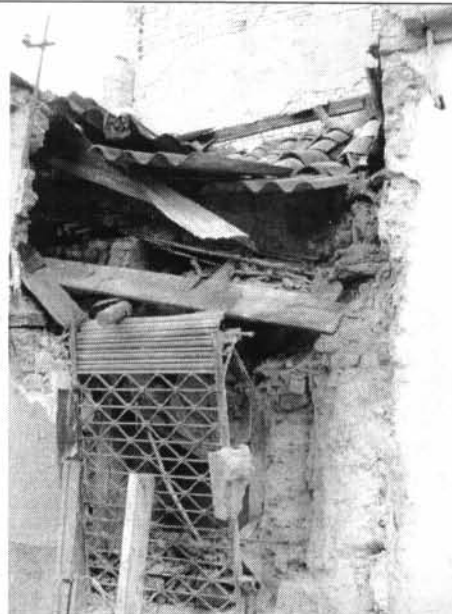
Foto 4. Fallo total de muros y cubierta.