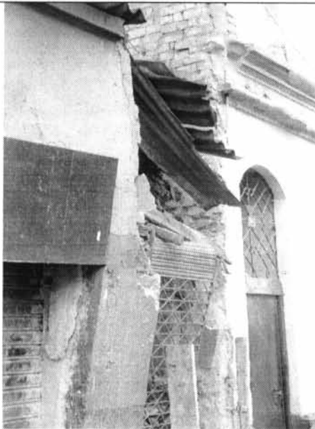
Foto 3. Muros fracturados con pérdida de verticalidad y fallo total.