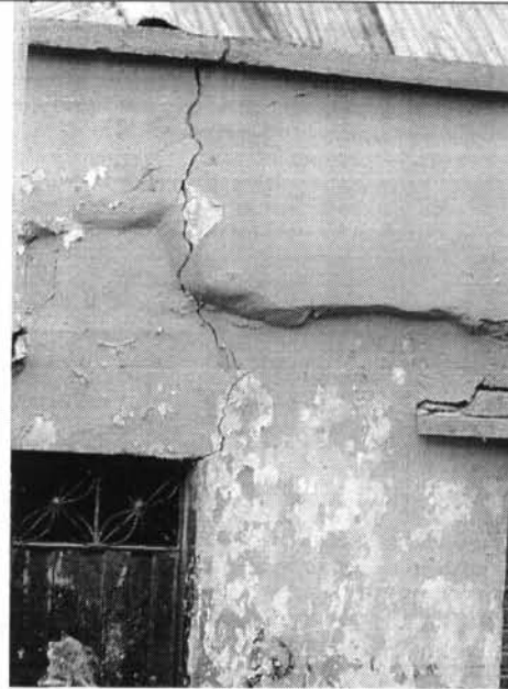
Foto 2. Muros de fachada fracturados.