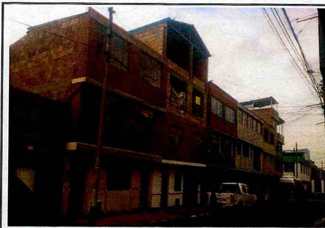
Fotografía 1. Vista del sector donde se ubica el inmueble emplazado en el predio de la Diagonal 52 C Bis Sur No. 28 – 71.