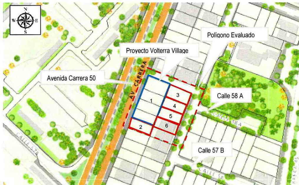
Figura 1. Localización de la zona donde se ubica el polígono valorado a la altura de la Avenida Carrera 50, entre la Calle 57 B y Calle 58 A, en el Sector Catastral Nicolás de Federman de la Localidad Teusaquillo.

El polígono evaluado se localiza a la altura de la Avenida Carrera 50 entre la Calle 57 B y Calle 58 A, en el Sector Catastral Nicolás de Federmán de la Localidad Teusaquillo y de acuerdo con el Plano del Plan de Ordenamiento Territorial de Bogotá - POT (Decreto 190 de 2004, por el cual se compilan los decretos 619 de 2000 y 469 de 2003), el sector no presenta cobertura de amenaza por movimientos en masa ni por inundación.