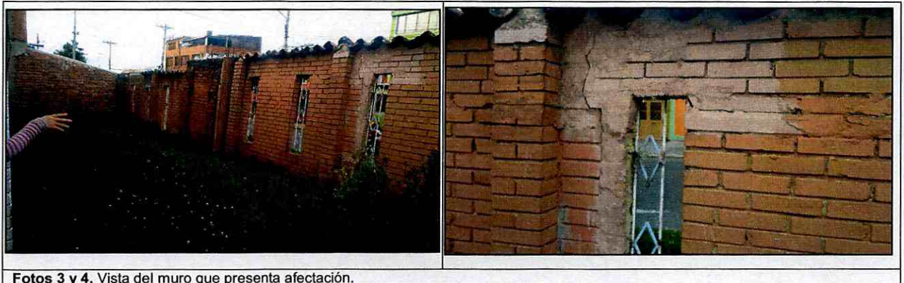
Fotos 3 y 4. Vista del muro que presenta afectación.