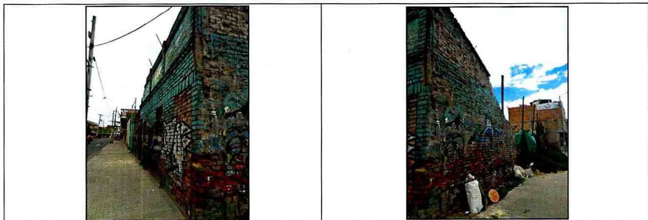
Fotos 3 y 4. Vista del muro que presenta afectación.