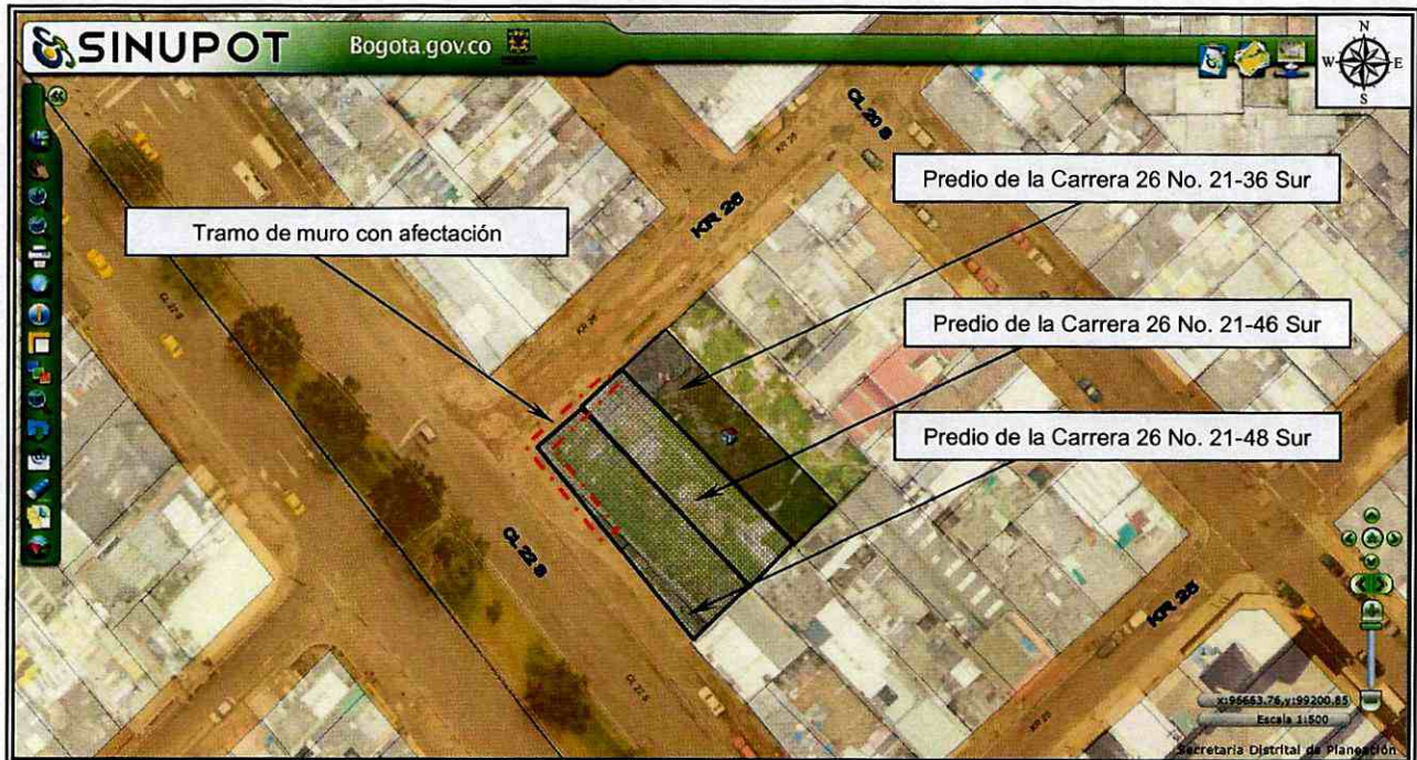
Figura 1. Localización del predio evaluado en el Sector Catastral Restrepo Occidental de la Localidad de Antonio Nariño.