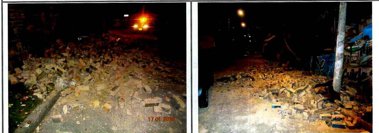
Foto No. 3 y 4. Material producto del colapso sobre la Calle 1 C Bis