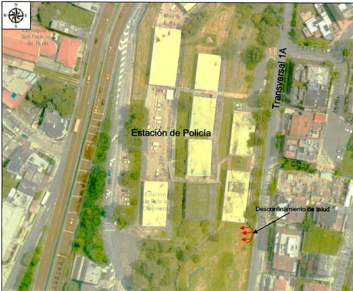
Figura 1. Localización de la zona evaluada en el Sector Catastral Ingemar de la Localidad de Chapinero.