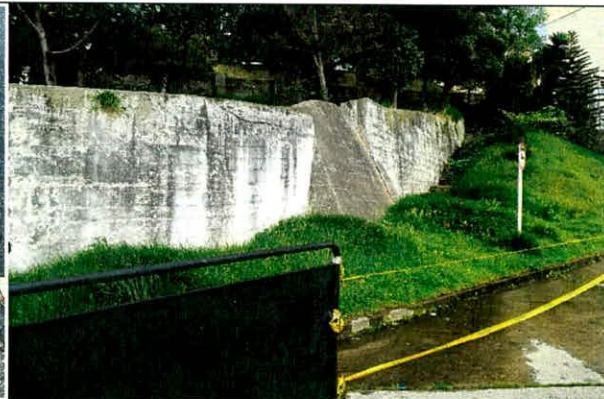
Fotografía 4. Sector evaluado al exterior de la estación de policía.