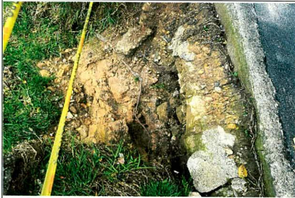
Fotografía 3. Material desprendido del talud