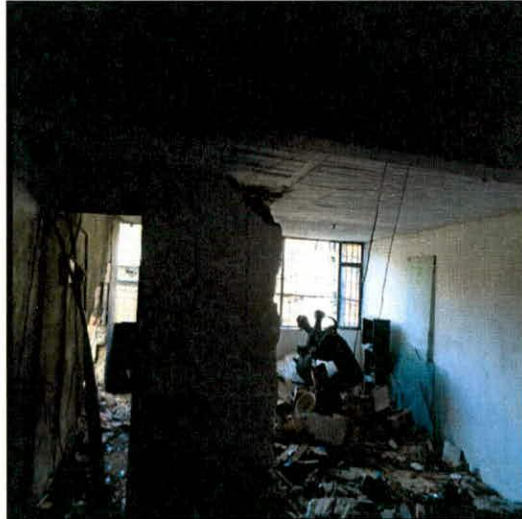
Fotografía 4 .Fracturas en muros divisorio del costado frontal del predio de la Carrera 24 No 1F-33