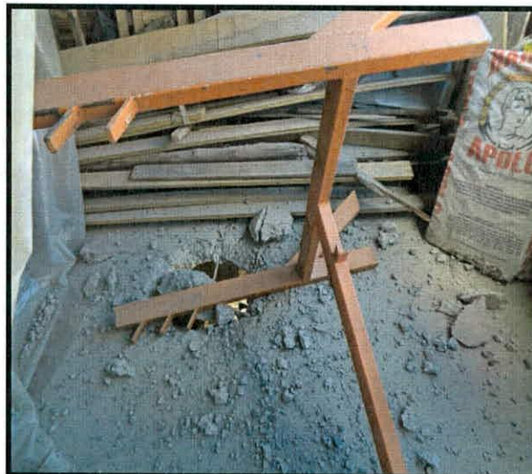
Fotografía 3 .Orificio en la placa de entepiso del costado frontal del predio de la Carrera 24 No 1F-33