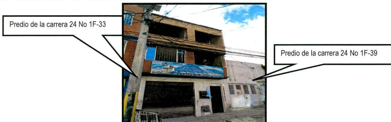
Fotografía 1 .Vista desde el exterior de las edificaciones emplazadas en los predios de la Carrera 24 No 1F-33 y Carrera 24 No 1F-39 en la Localidad de Mártires