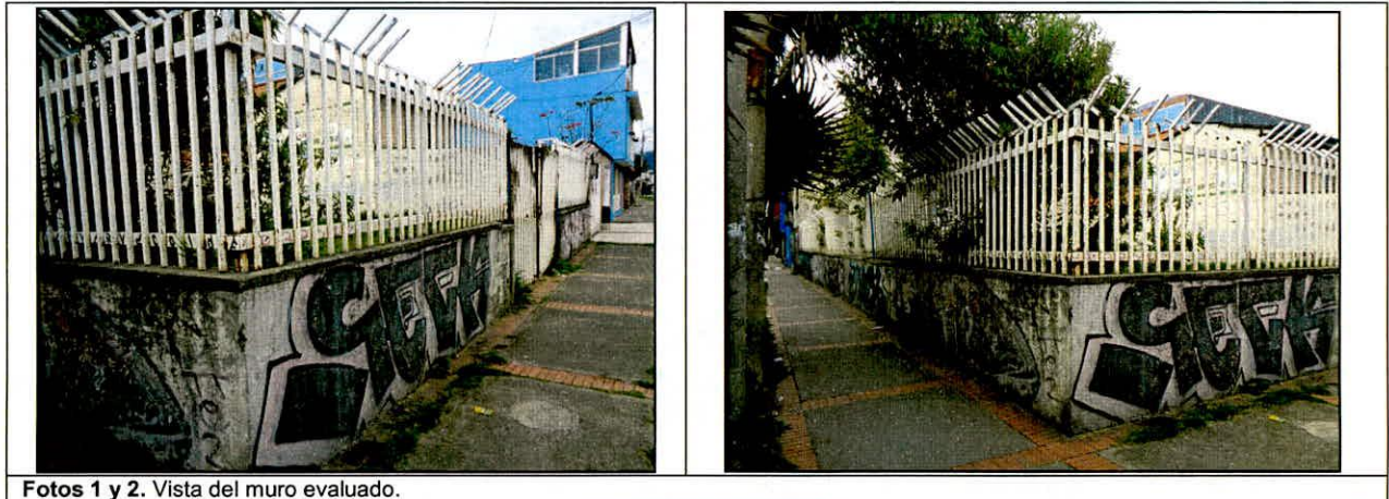
Fotos 1 y 2. Vista del muro evaluado.