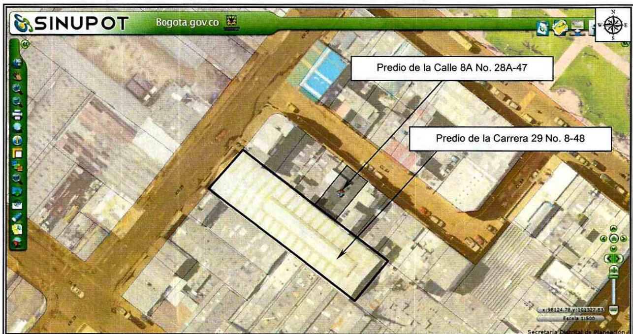
Figura 1. Localización de los predios evaluados en el Sector Catastral Ricaurte de la Localidad de Los Mártires (Imagen tomada de SINUPOT).