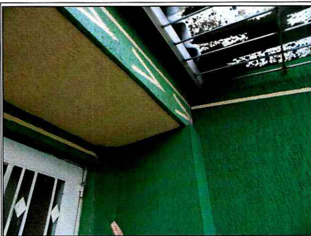
Fotos 2. Vista de los daños que presenta la vivienda evaluada.