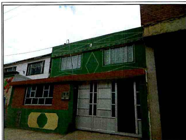
Fotos 1. Vista de la edificación emplazada en el predio de la Carrera 8A No. 27B-20 Sur, en el sector Catastral Veinte de Julio de la Localidad de San Cristóbal.