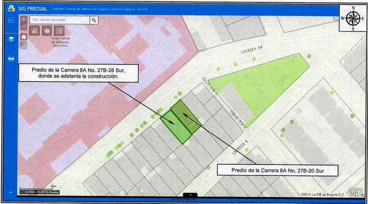
Figura 1. Localización de los predios evaluados, en el Sector Catastral Veinte de Julio de la Localidad de San Cristóbal.