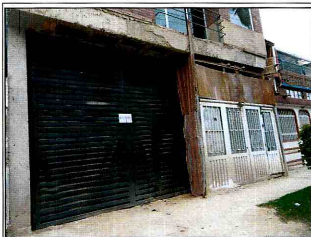
Foto 9. Vista de la construcción que se adelanta en el predio de la Carrera 8A No. 27B-28 Sur, en el Sector Catastral Veinte de Julio de la Localidad de San Cristóbal.