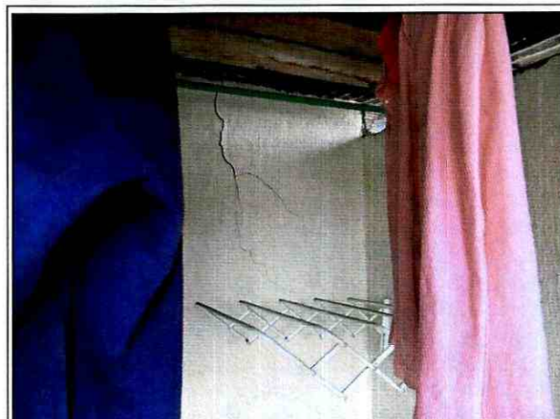
Fotos 3 y 4. Vista de los daños que presenta la vivienda evaluada.