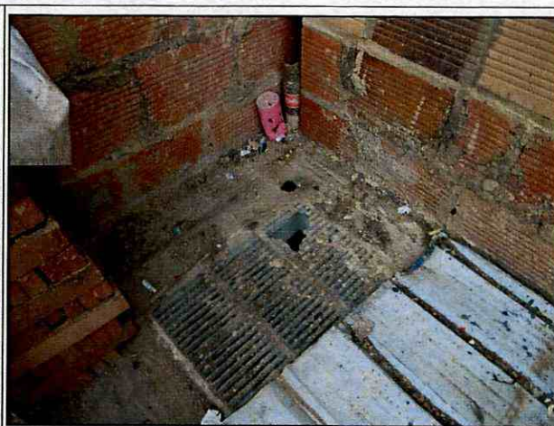
Fotos 5 y 6. Vista de los daños que presenta la vivienda evaluada.