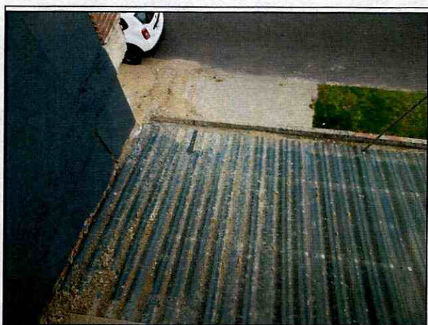
Foto 7. Vista de los daños que presenta la vivienda evaluada.