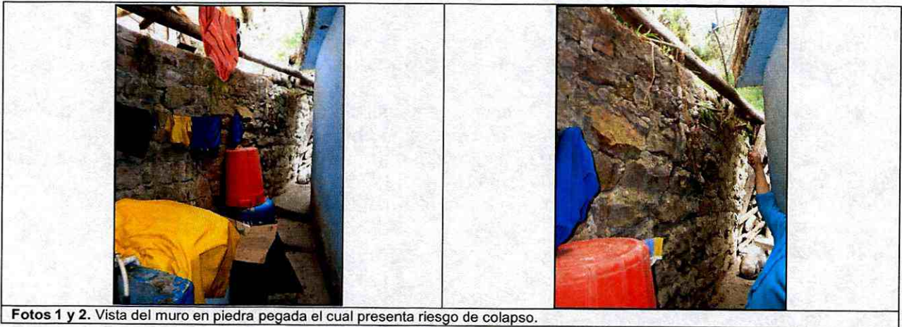
Fotos 1 y 2. Vista del muro en piedra pegada el cual presenta riesgo de colapso.