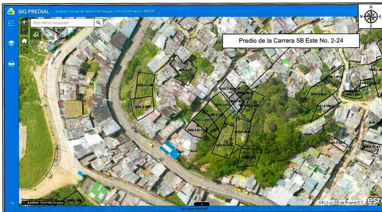
Figura 1. Localización del predio de la Carrera 5B Este No. 2-24, en el Barrio Santa Rosa de Lima de la Localidad de Santa fe.