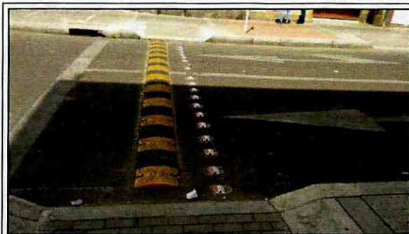
Foto 1. Vista del tramo vial localizado en la Calle 23 con Carrera 18 Bis, en el sector Catastral Santa Fe de la Localidad de Los Mártires.