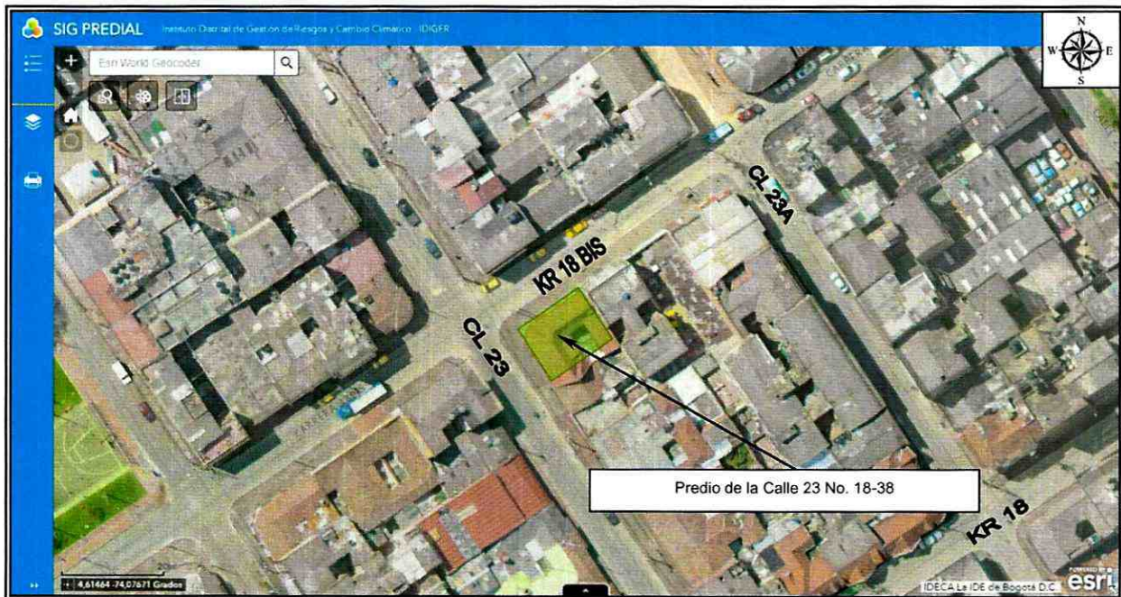
Figura 1. Localización de los predios evaluados en el Sector Catastral La Sabana de la Localidad de Los Mártires.