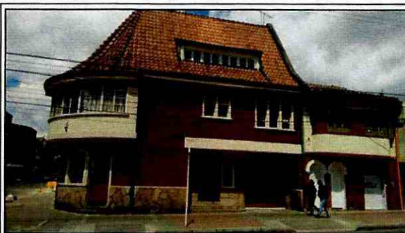
Foto 2. Vista de la vivienda emplazada en el predio de la Calle 23 No. 18-38, en el Sector Catastral Santa Fe de la Localidad de Los Mártires.