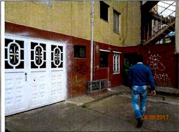
Fotografía 3. Predio de la Carrera 5 No. 48Q – 60 Sur Int. 3 Apto 101