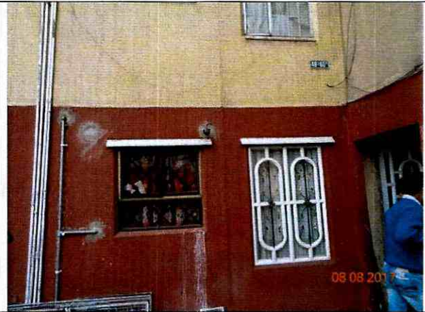
Fotografía 4. El sistema estructural corresponde aparentemente a muros de carga.