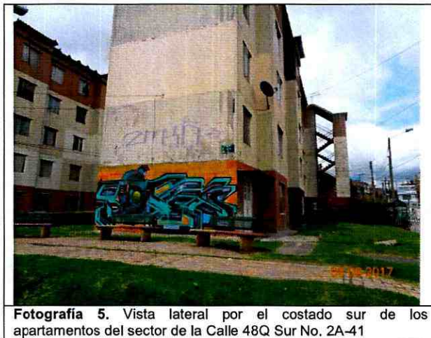
Fotografía 5. Vista lateral por el costado sur de los apartamentos del sector de la Calle 48Q Sur No. 2A-41