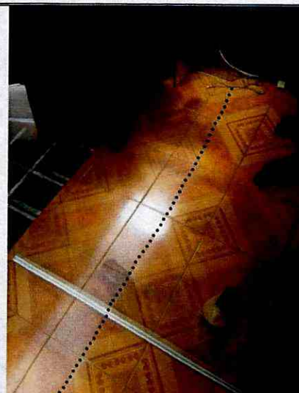
Fotografía 8. Fisuras identificadas en losetas de piso de la zona posterior de la vivienda ubicada en el predio de la Carrera 73 A No. 63 – 41, en el Sector Catastral El Encanto de la Localidad Engativá.