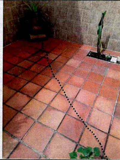
Fotografía 6. Fisuras identificadas en losetas de piso de la zona del patio de la vivienda ubicada en el predio de la Carrera 73 A No. 63 – 41, en el Sector Catastral El Encanto de la Localidad Engativá.