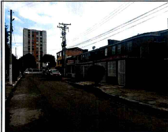
Fotografía 1. Vista del sector donde se ubica la vivienda del predio de la Carrera 73 A No. 63 – 41, en el Sector Catastral El Encanto de la Localidad Engativá.