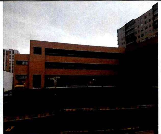
Fotografía 10. Edificación construida al interior del Vista del colegio Margarita Bosco, ubicada en el predio de la Av. Calle 63 No. 73 A – 44, en el Sector Catastral El Encanto de la Localidad Engativá, colindante con el predio de la Carrera 73 A No. 63 – 41.