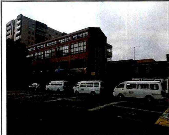
Fotografía 9. Vista del colegio Margarita Bosco, ubicada en el predio de la Av. Calle 63 No. 73 A – 44, en el Sector Catastral El Encanto de la Localidad Engativá.