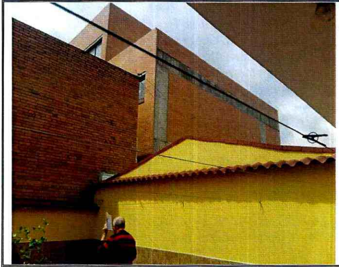
Fotografía 3. Zona de patio de la vivienda ubicada en el predio de la Carrera 73 A No. 63 – 41, la cual es colindante con la construcción que se desarrolló en el colegio Margarita Bosco.