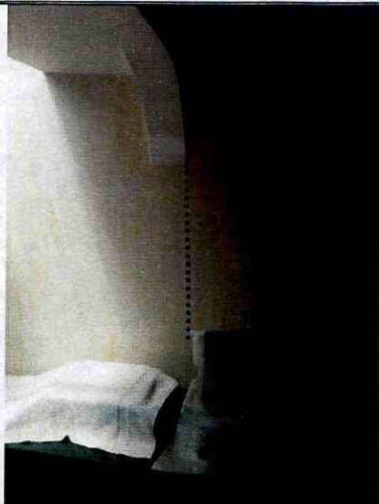
Fotografía 7. Fisuras identificadas en muros de cerramiento de la zona posterior de la vivienda ubicada en el predio de la Carrera 73 A No. 63 – 41, en el Sector Catastral El Encanto de la Localidad Engativá.