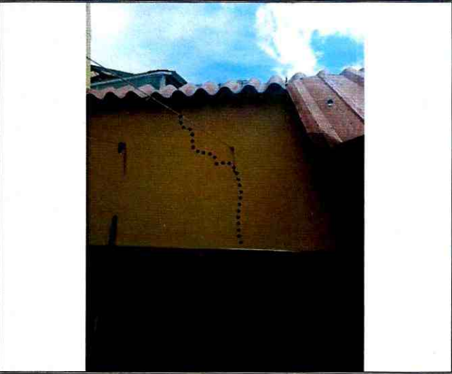
Fotografía 4. Fisuras identificadas en muros de cerramiento de la zona del patio de la vivienda ubicada en el predio de la Carrera 73 A No. 63 – 41.