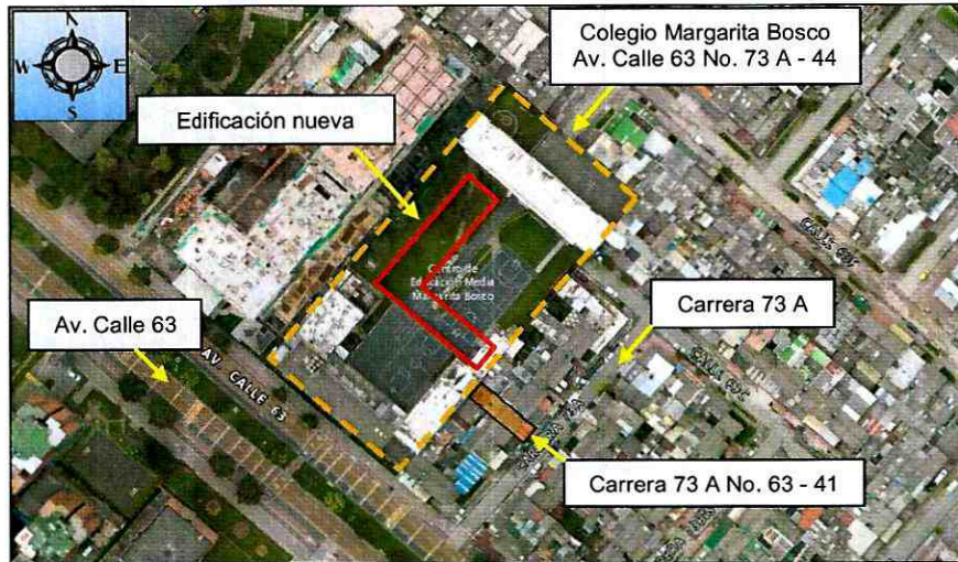
Figura 1. Aerofotografía del sector donde se ubica el predio de la Carrera 73 A No. 63 – 41 y el colegio Margarita Bosco en el predio de la Av. Calle 63 No. 73 A - 44, en el sector Catastral El Encanto de la Localidad Engativá.