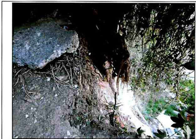
Foto 5. Vista del sector donde se están presentando los desprendimientos de material.