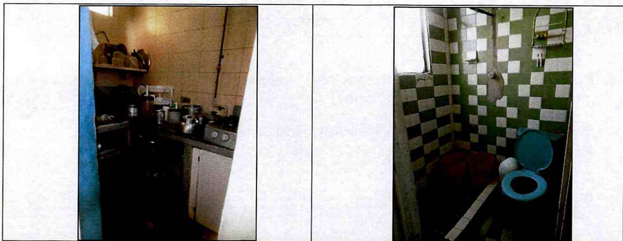
Fotos 3 y 4. Vista al interior de la vivienda evaluada, en la que no se aprecian daños que comprometan la estabilidad estructural de la misma.