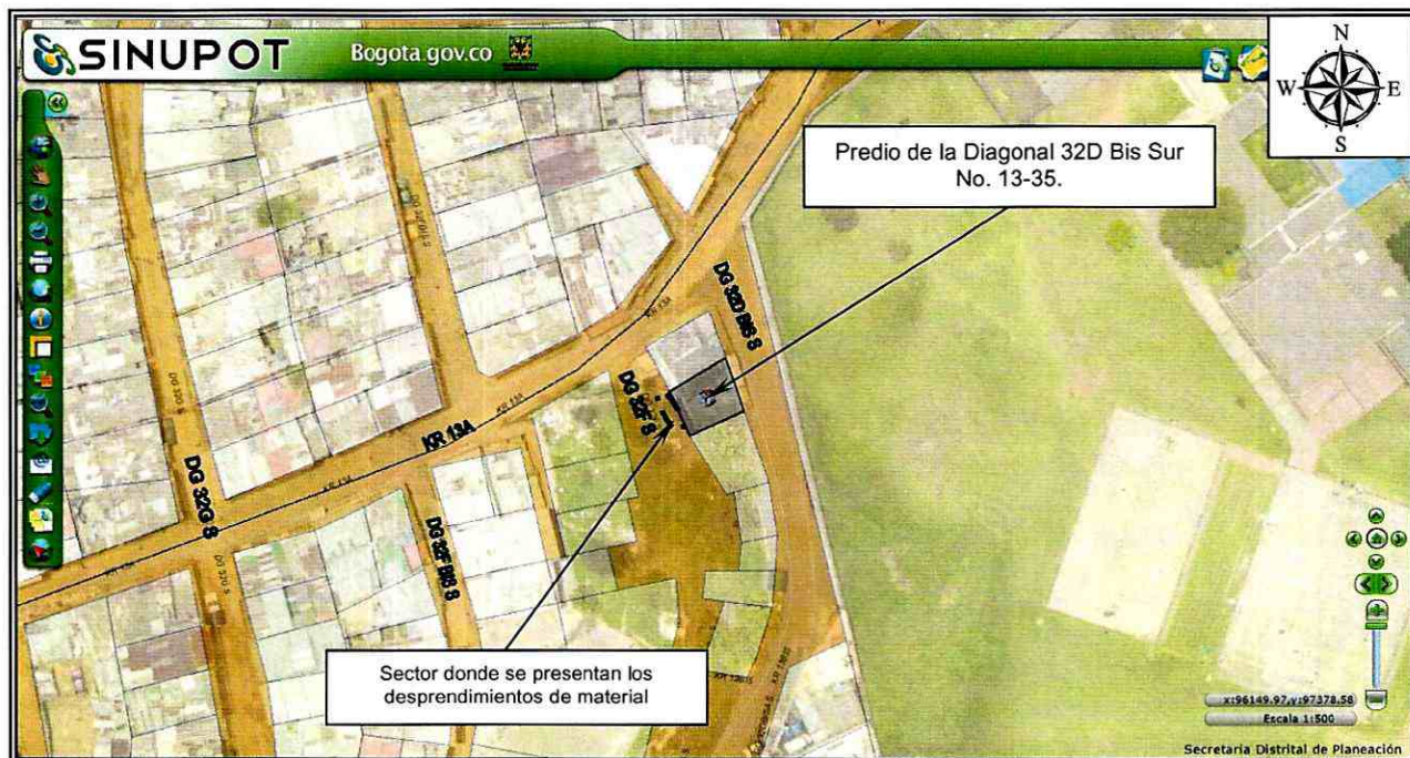
Figura 1. Localización del predio de la Diagonal 32D Bis Sur No. 13-35, en el Barrio Luis López de Mesa de la Localidad de Rafael Uribe Uribe.