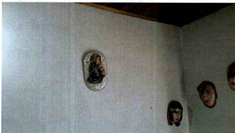
Fotografía 4. Muros interiores de la edificación sin daños