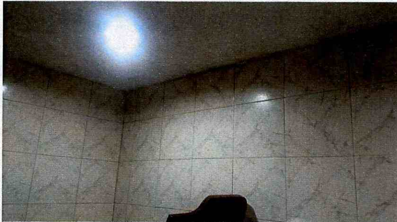
Fotografía 6. En los acabados tipo enchape de los muros de baño y cocina no se presentan fracturas que indiquen mal comportamiento de la edificación