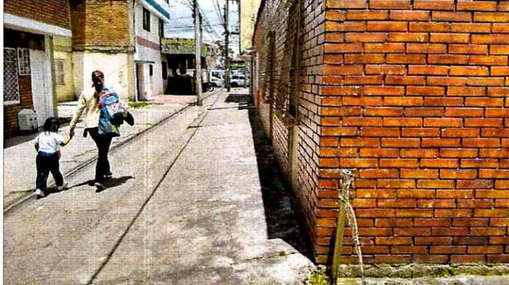
Fotografía 2. No se observan daños ni hundimientos de la edificación en el costado de la Carrera 87 B. El muro de fachada se encuentra en buen estado, no presenta fisuras perceptibles a la vista.