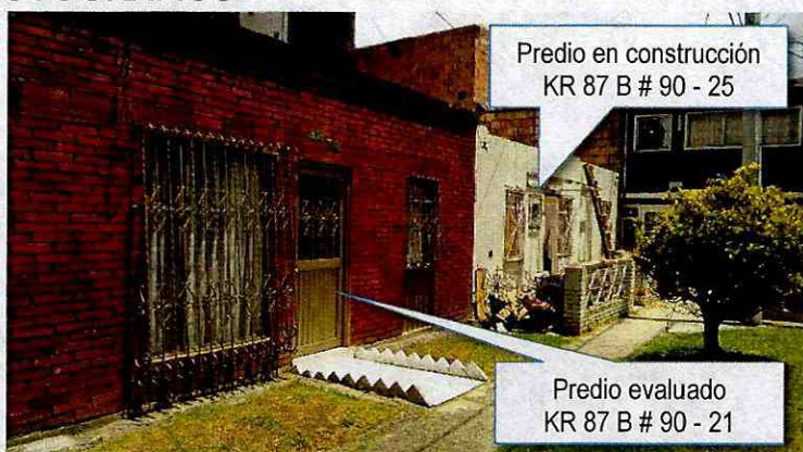
Fotografía 1. Vista general de los inmuebles ubicados en la Carrera 87 B # 90 - 21 (Predio 1, figura 2) y Carrera 87 B # 90 - 21 (Predio 2, figura 1).