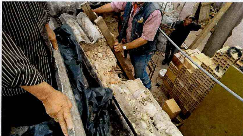
Fotografía 7. Demolición parcial del muro de lindero por parte de los responsables de la obra del predio de la Carrera 87 B # 90 – 21 (Predio 2, figura 1).