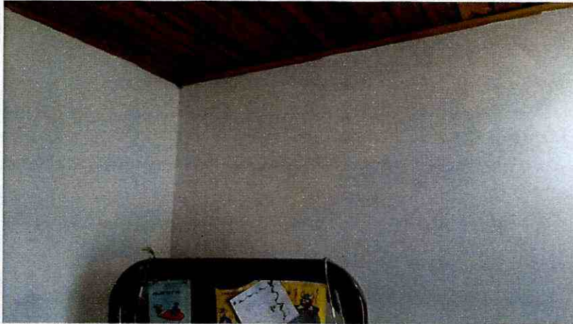
Fotografía 5. Muros y acabado del cielo raso en madera en buenas condiciones