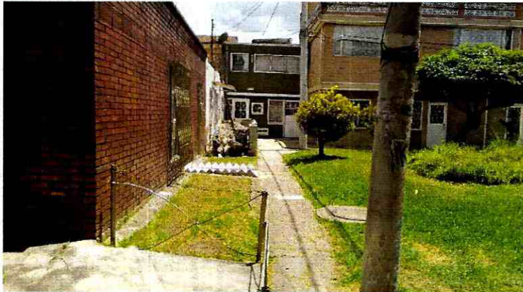
Fotografía 3. Andén y muro de fachada en buenas condiciones.