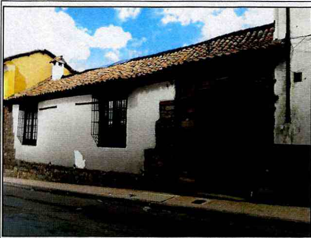
Foto 1. Vista de la fachada de la edificación emplazada en el predio de la Carrera 4 No. 10-54, en el Sector Catastral Centro Administrativo de la Localidad de La Candelaria.