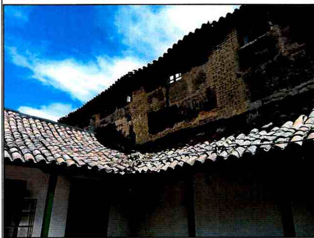
Foto 3. Vista del estado del muro de cerramiento del predio de la Carrera 4 No. 10-40.