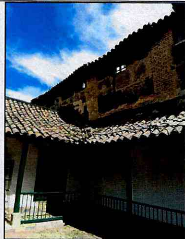
Foto 2. Vista del sector donde se depositaron los escombros producto del colapso parcial del muro de cerramiento de la edificación emplazada en el predio de la Carrera 4 No. 10-40