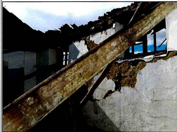
Foto 5 y 6. Vista desde el interior de la edificación del estado del muro de cerramiento, el cual presenta riesgo de colapso hacia el predio de la Carrera 4 No. 10-54.