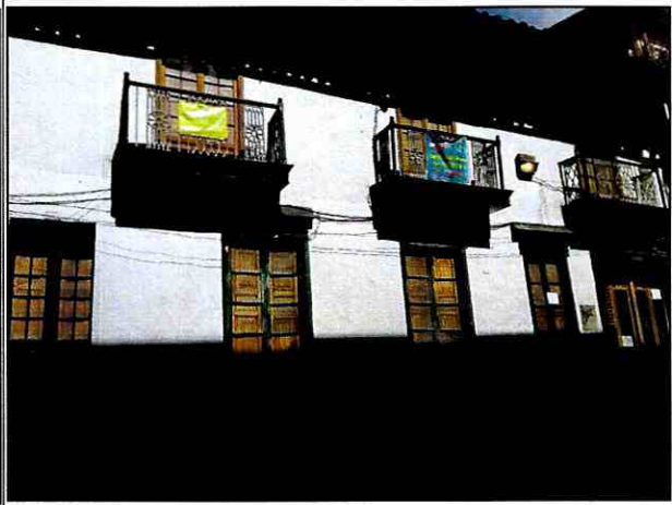
Foto 4. Vista de la fachada de la edificación emplazada en el predio de la Carrera 4 No. 10-40, en el sector Catastral Centro Administrativo de la Localidad de La Candelaria.