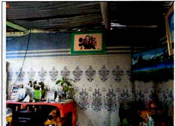
Fotografía 5. Restricción en la sala de la vivienda aledaña por el material de la vivienda aledaña que la impacto.