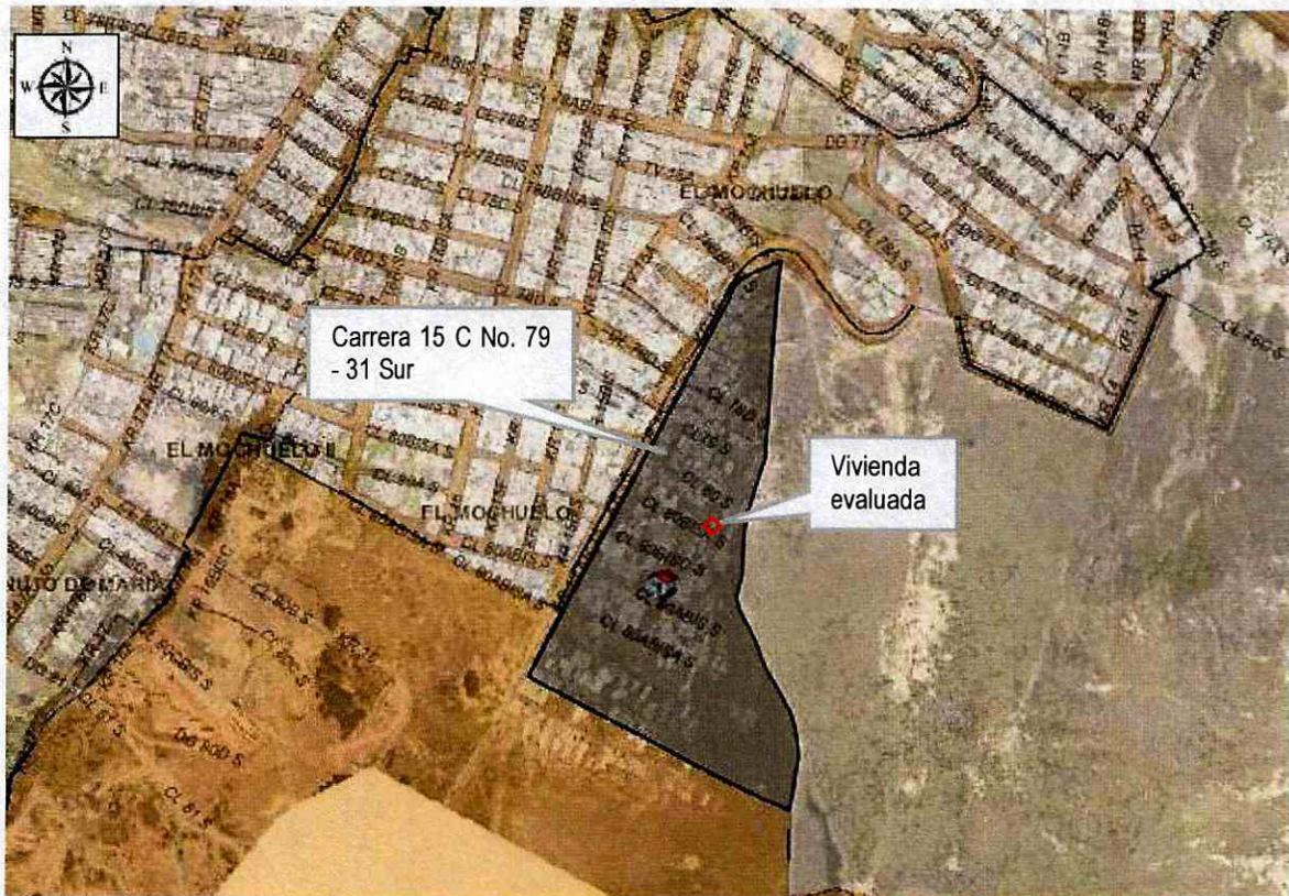
Figura 1. Localización de la vivienda evaluada emplazada en el predio de la Carrera 15 C No. 79 - 31 Sur, Sector Catastral El Mochuelo II Urbano de la Localidad de Ciudad Bolívar.