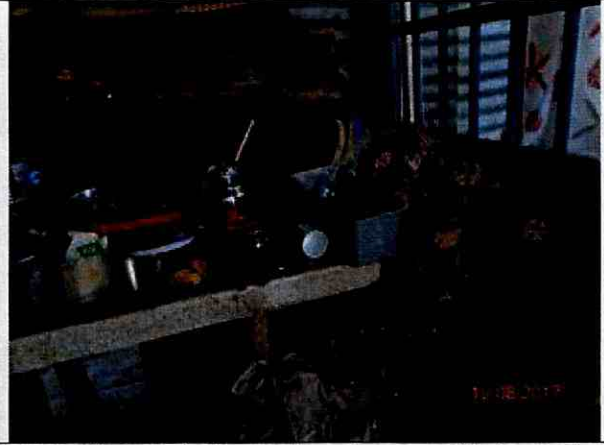
Fotografía 4. Afectaciones en la cocina por pérdida de soporte.