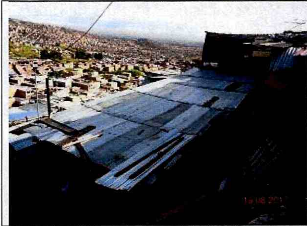
Fotografía 3. Vivienda de la parte baja afectada por la caída de material