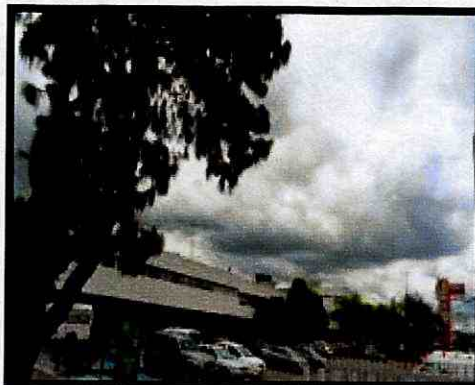
Fotografías 1. Sede de la Cruz Roja - Seccional Cundinamarca y Bogotá