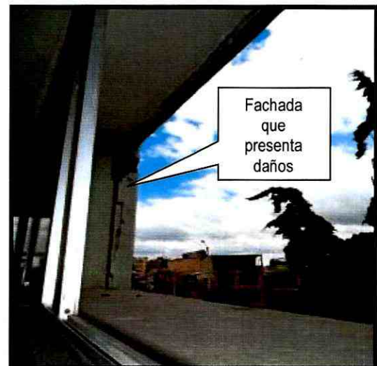
Fotografías 3 y 4. Fachada que presenta daños en la edificación que se encuentra junto a la media torta en la sede de la Cruz Roja -Seccional Cundinamarca y Bogotá.