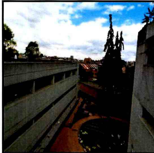
Fotografía 2. Edificación junto a la zona denominada como media torta