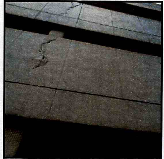
Fotografías 5 y 6. Fisuras en los enchapes de fachada de la edificación evaluada en la sede de la Cruz Roja -Seccional Cundinamarca y Bogotá.