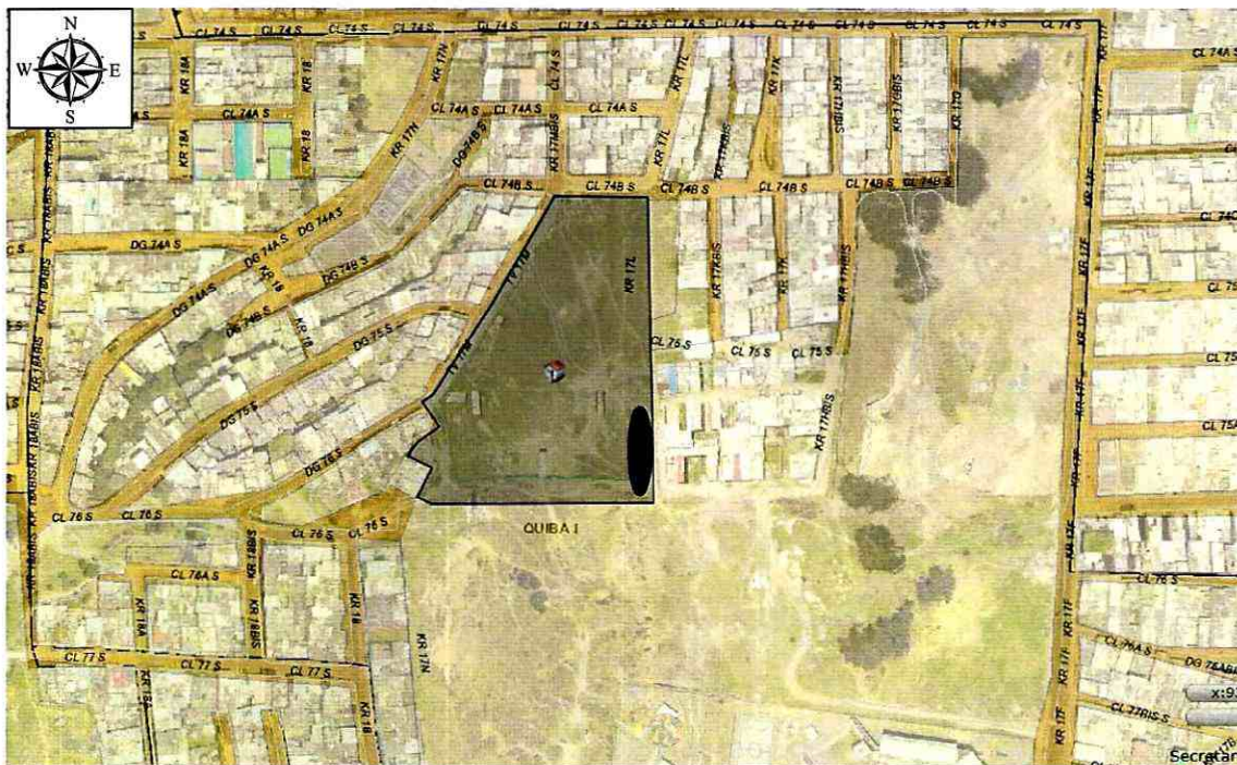
Figura 1. Localización del sector evaluado en atención del Evento SIRE No. 4548434, en el Sector Catastral Quiba I de la Localidad de Ciudad Bolívar (Imagen tomada SINUPOT).

De acuerdo con el Plano Normativo de Amenaza por Remoción en Masa del Plan de Ordenamiento Territorial de Bogotá, POT (Decreto 190 de 2004), el sector donde se localiza el predio evaluado, presenta categorización de Amenaza Media por Movimientos en Masa.