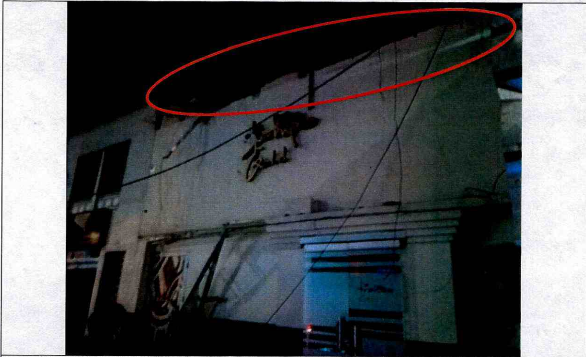
Fotografía 1: Vista de los daños evidenciados en la edificación emplazada en el predio de la Calle 53 No 27A-31, en la Localidad de Teusaquillo.