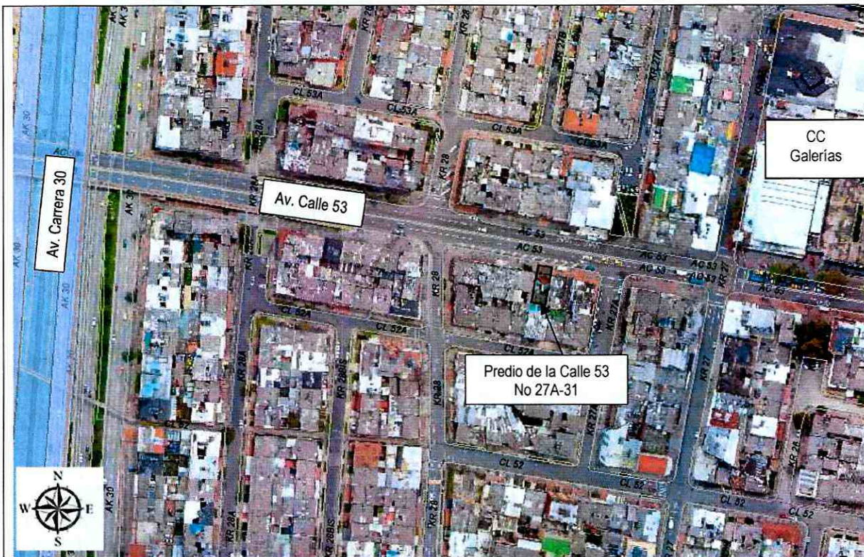
Figura 1. Localización del predio de la Calle 53 No 27A-31, en la Localidad de Teusaquillo