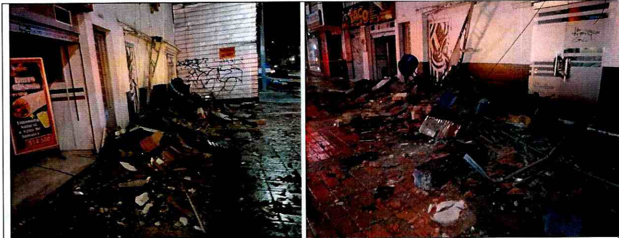
Fotografía 2: Vista del material depositado sobre el sendero peatonal por el colapso parcial del voladizo del predio Calle 53 No 27A-31, en la Localidad de Teusaquillo.