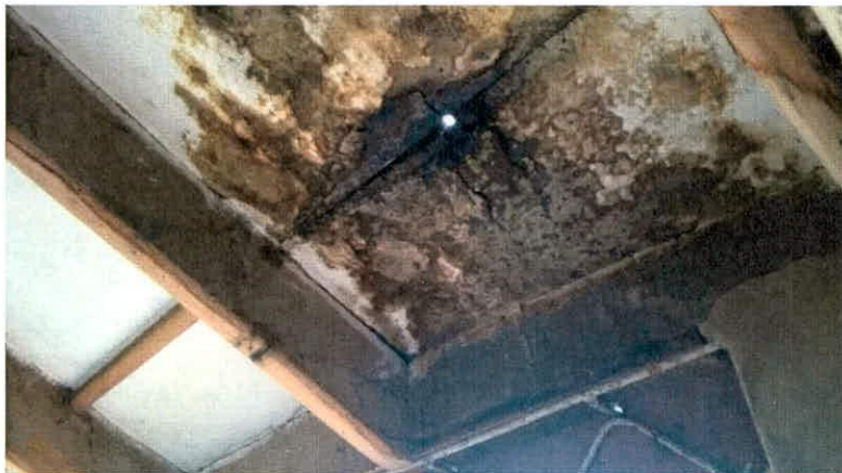
Fotografía 6. Presencia de humedad en el cielo raso de la edificación