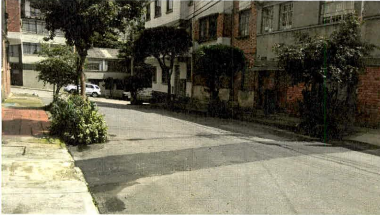
Fotografía 2. Vista general del sector donde se ubica la edificación de la Carrera 3A # 26B - 17.