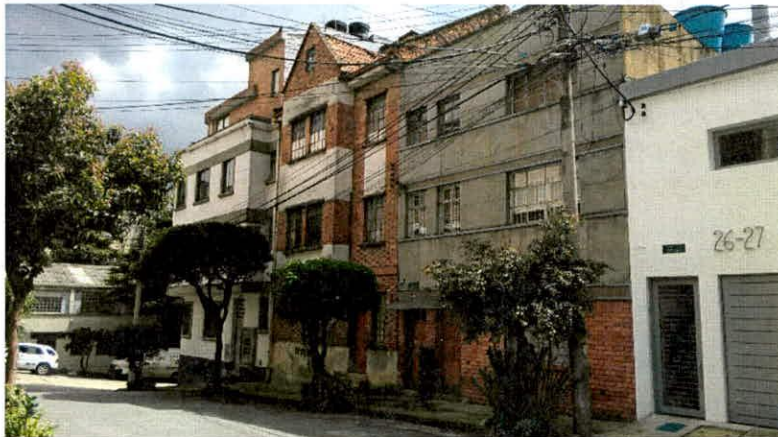
Fotografía 1. Vista general del inmueble ubicado en la Carrera 3A # 26B - 17.