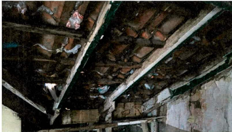
Fotografía 5. Tejas de barro que conforman la cubierta en buen estado.