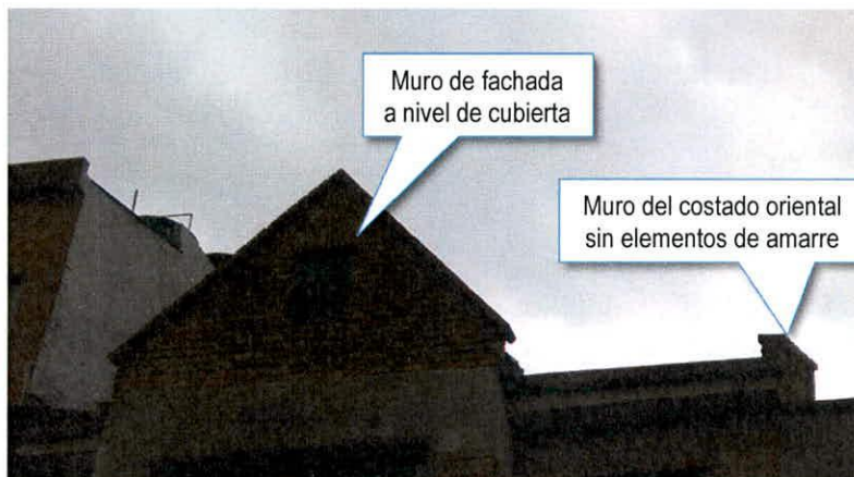
Fotografía 7. Elementos de mampostería de la cubierta sin elementos de confinamiento.