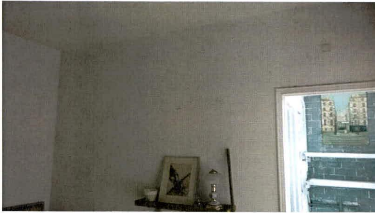
Fotografía 3. Muros divisorios en buenas condiciones