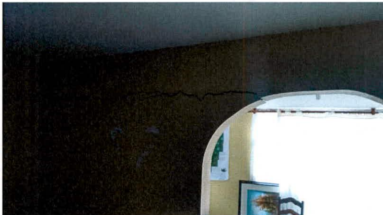
Fotografía 5. Grieta horizontal un muro de alcoba ubicada en el costado suroriental del predio de la Diagonal 74B # 87 – 62.