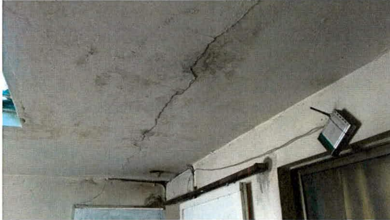
Fotografía 4. Grieta en la placa de entrepiso ubicada en el patio interior de la vivienda de la Diagonal 74B # 87 – 62.