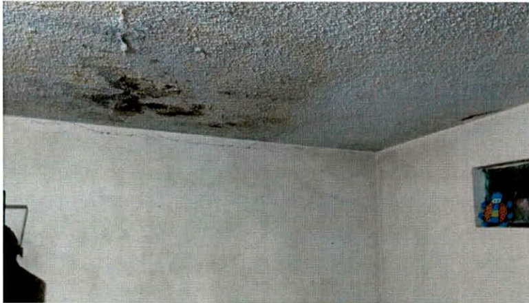
Fotografía 6. Presencia de humedad en placa de terraza.