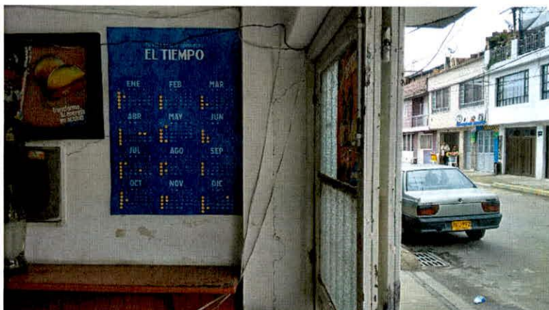
Fotografía 2. Grieta vertical en muros del costado suroriental del predio de la Diagonal 74B # 87 – 62.