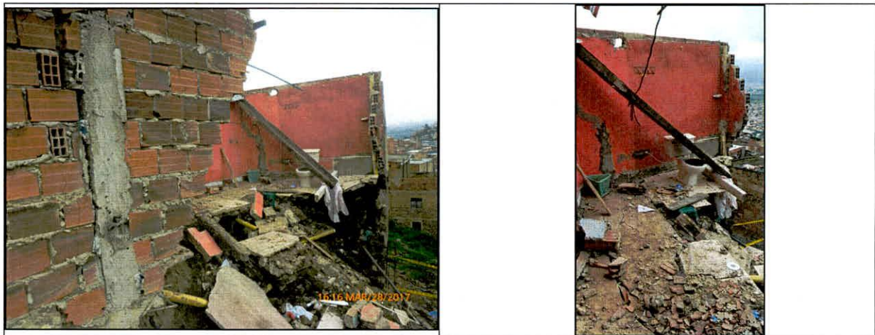
Fotos 3 y 4. Vista del sector de la vivienda que presentó el colapso.