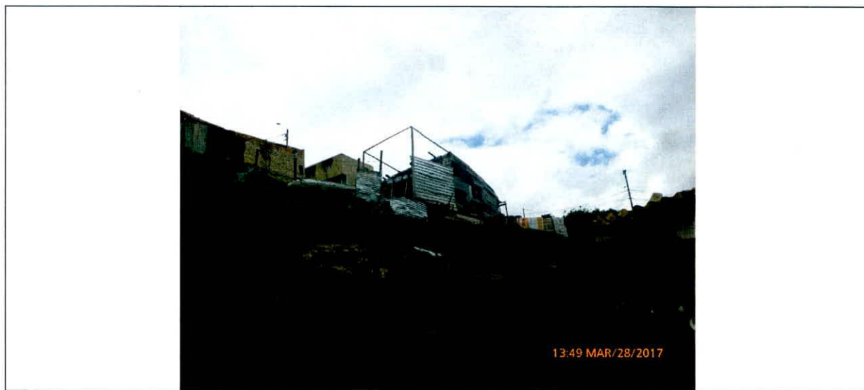
Fotografía No. 1. Vista desde el predio inferior de las condiciones actuales del predio de la Calle 73Sur 23A-15 del Barrio Los Alpes Sur de la Localidad de Ciudad Bolívar