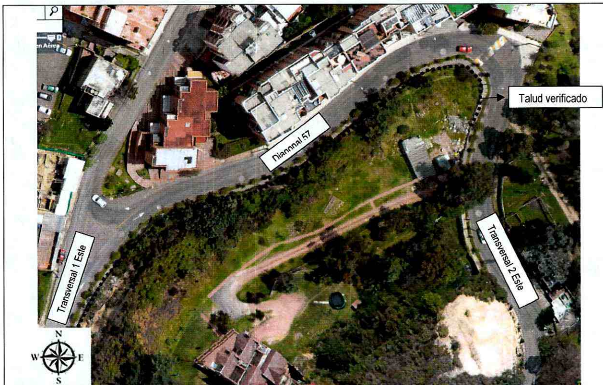
Figura 1. Localización del sector evaluado sobre la Transversal 1 Este y Transversal 2 Este con Diagonal 57, en la Localidad de Chapinero