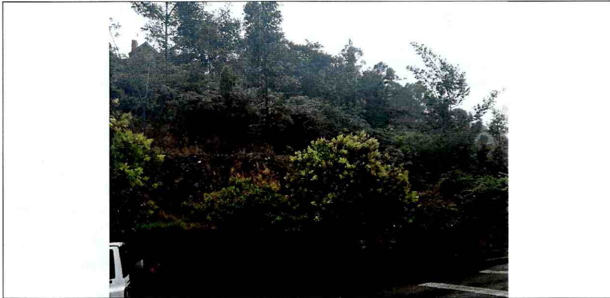
Fotografía 2 : Vista de la zona evaluada sobre la Diagonal 57 entre Transversal 1 Este y Transversal 2 Este en la Localidad de Chapinero