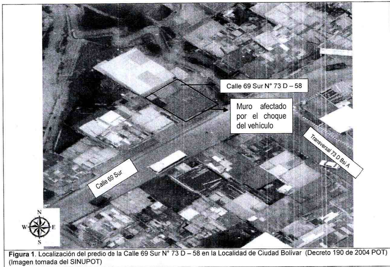
Figura 1. Localización del predio de la Calle 69 Sur N° 73 D - 58 en la Localidad de Ciudad Bolívar (Decreto 190 de 2004 POT)

IDIGER, no ha emitido concepto técnico de riesgo, sin embargo de acuerdo con el Plano Normativo de Amenaza por Remoción en Masa del Plan de Ordenamiento Territorial de Bogotá - POT , el sector donde se localiza el predio de la referencia, presenta condición de amenaza media por procesos de remoción en masa y presenta Amenaza media por Inundación.