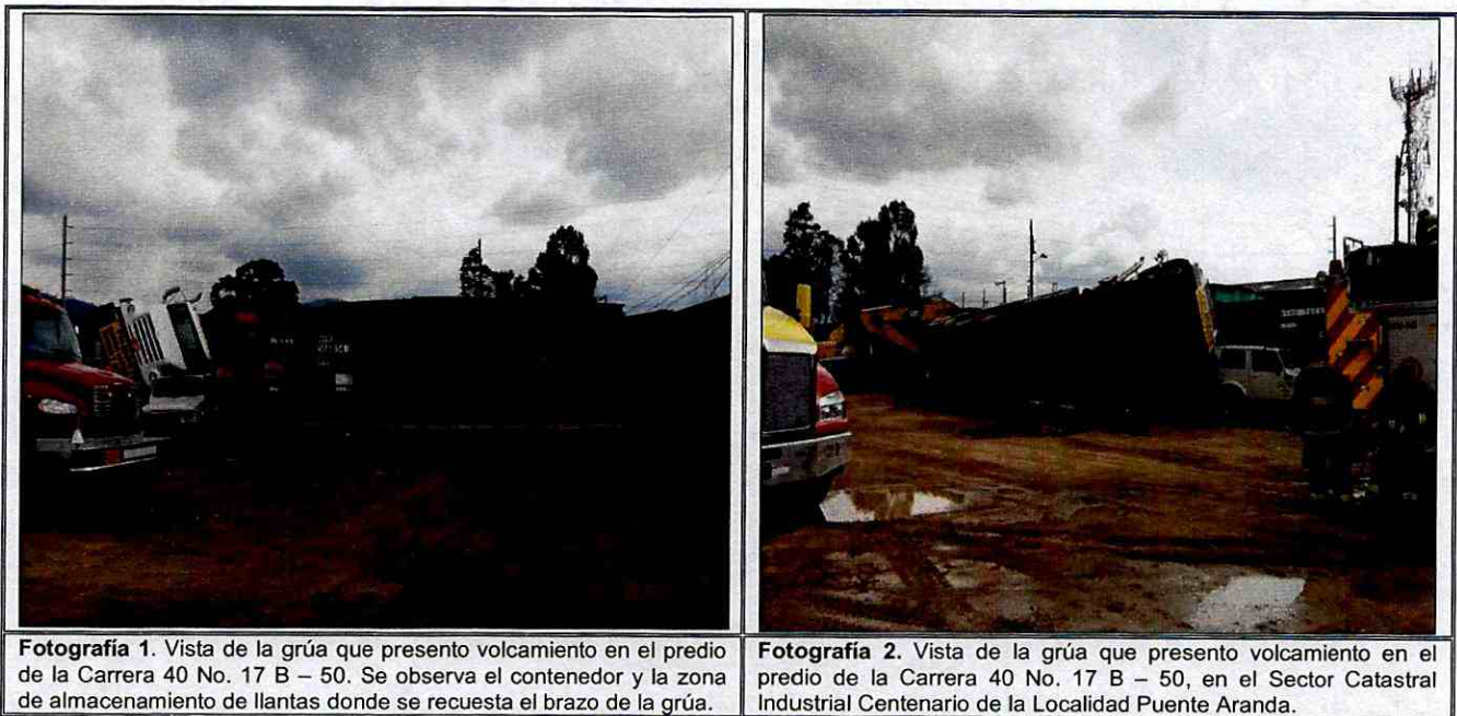
Fotografía 1. Vista de la grúa que presentó volcamiento en el predio de la Carrera 40 No. 17 B – 50. Se observa el contenedor y la zona de almacenamiento de llantas donde se recuesta el brazo de la grúa.