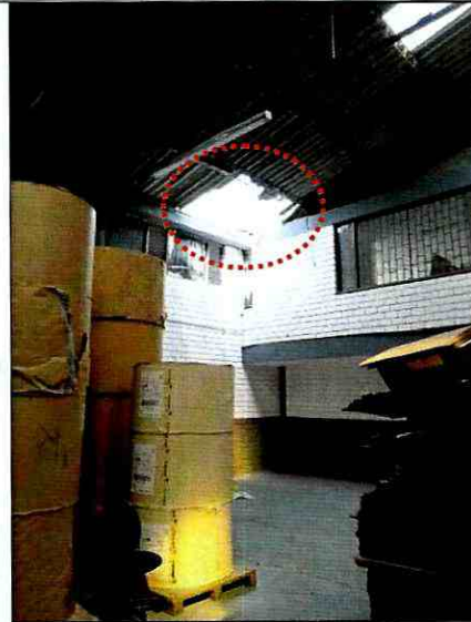
Fotografía 4. Cubierta afectada en el predio de la Calle 17 B No. 39 – 61, donde funciona le empresa Tecnopres Grafica S.A.