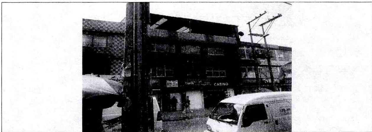
Fotografía 1: Vista de la fachada de la edificación emplazada en el predio de la Carrera 9 N° 50 A - 14/16 Sur en la Localidad de Rafael Uribe Uribe.