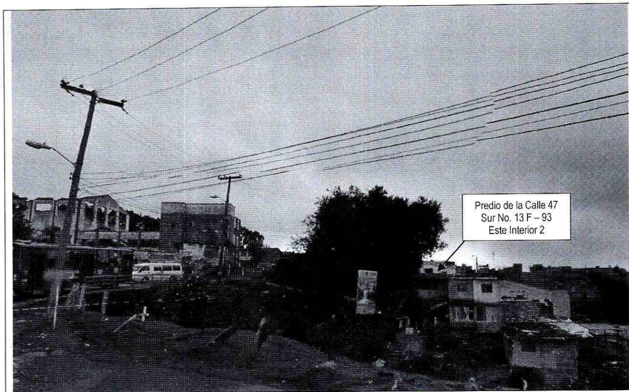
Fotografía 5 – Localización del predio de la Calle 47 Sur No. 13 F – 93 Este Interior 2 – Se observa su localización a media ladera sobre el talud de la margen izquierda de la quebrada Chiguaza