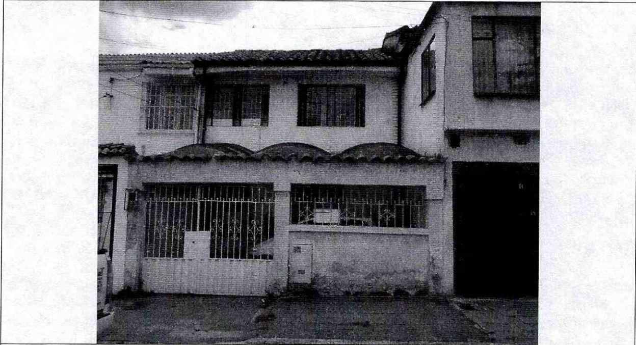
Fotografía 1: Vista de la vivienda de la Calle 63 C N° 22-18, en la Localidad de Barrios Unidos